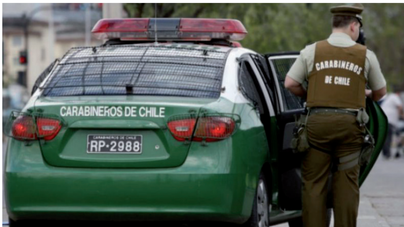
La víctima fue identificada como F.L.C, un ciudadano chileno de 31 años de edad, quien según fuentes de El Día, sería residente de la comuna de Ovalle.

Tras recibir el impacto de bala, el hombre fue llevado en un vehícu-