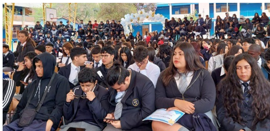
El Liceo Estela Ávila Molina de Perry abrirá un nuevo curso en primero medio, para recibir a los estudiantes sin matrícula.

Chacana, sostuvo que "ha sido una preocupación constante para el DEM y la alcaldía, la cantidad de estudiantes de primero medio que estaban sin cupos, y por ende sin clases, por lo tanto comenzamos a trabajar junto a la Seremía y la Dirección Provincial Limarí para que estos escolares puedan acceder lo más pronto posible a la educación, ya que es un derecho garantizado por la educación. Esperamos que con estos nuevos cupos podamos dejar satisfecha a toda la población de la comuna y como es nuestro objetivo, que todos y todas las estudiantes accedan a una educación de calidad".