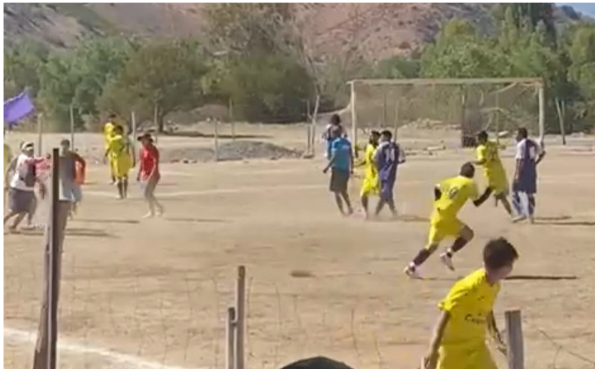
El imputado efectuó disparos tras una riña en una cancha de fútbol rural de la comuna de Monte Patria.

Tras esto, se instruyeron diligencias a la Brigada de Investigación Criminal de Ovalle de la PDI, y así lo comentó el subprefecto Daniel Leal Parada, "tras desarrollar las primeras diligencias, los detectives establecen la participación del hombre de 20 años como presunto autor de los disparos, quién había sido detenido por personal de Carabineros tras el incidente con arma de fuego. Dentro del trabajo de análisis criminal e inteligencia policial se efectuó el reconocimiento del individuo, mediante diversas evidencias fotográficas y registros audiovisuales que circularon por Redes Sociales, empadronamiento, declaración de la víctima y testigos de la balacera que presenciaban el encuentro deportivo. Todos los antecedentes fueron remitidos al Ministerio Público", puntualizó.