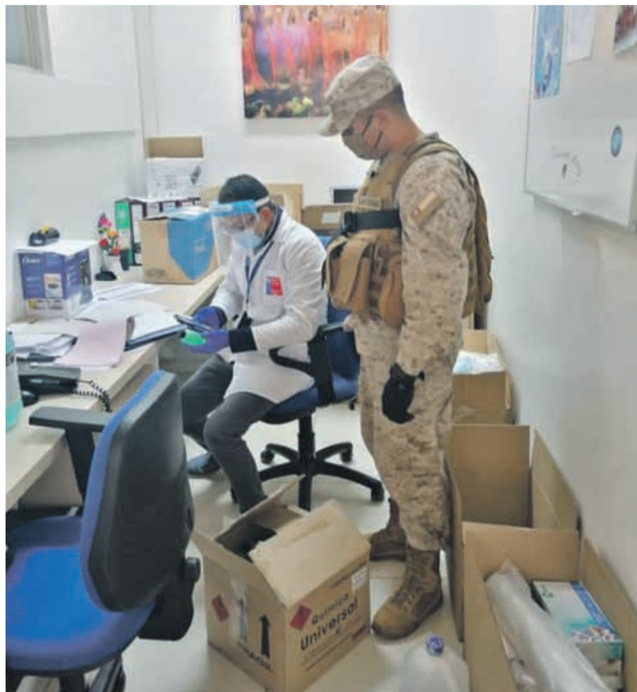
Fiscalizadores de la Seremi de Salud y militares han recorrido comercios y diversos locales detectando fallas de sanidad en varios de ellos.