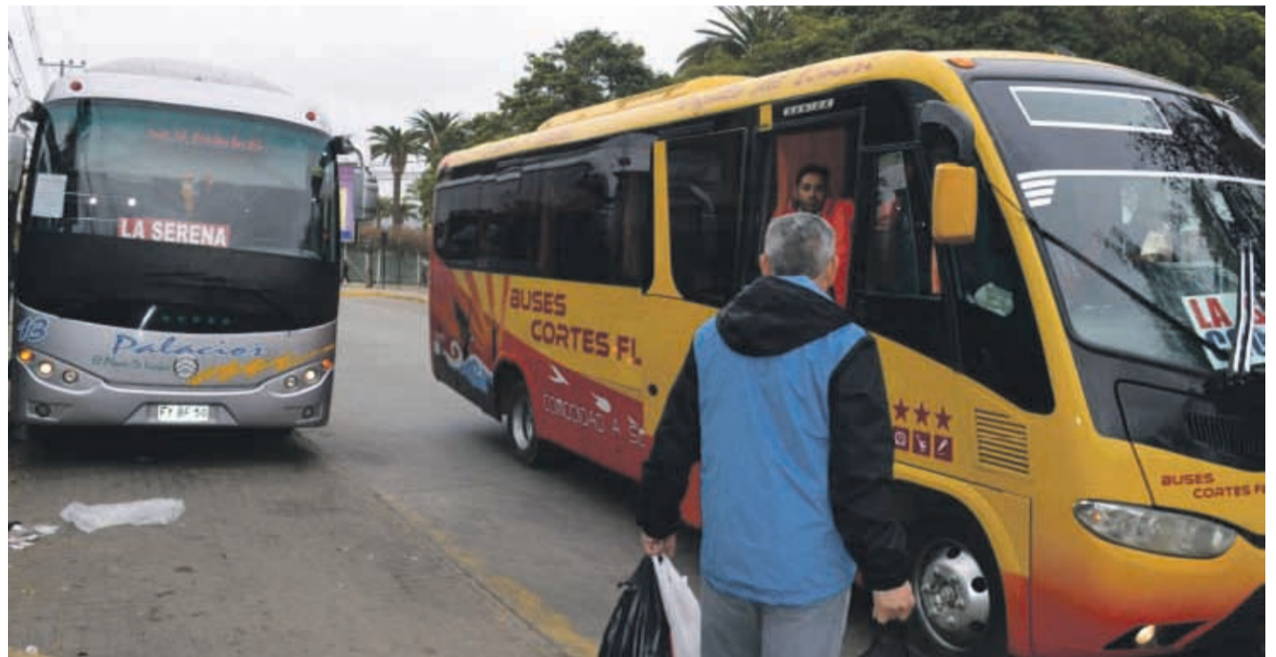
Uno de los trayectos que tendrán 50% de rebaja para adultos mayores será el recorrido Ovalle-Coquimbo La Serena.