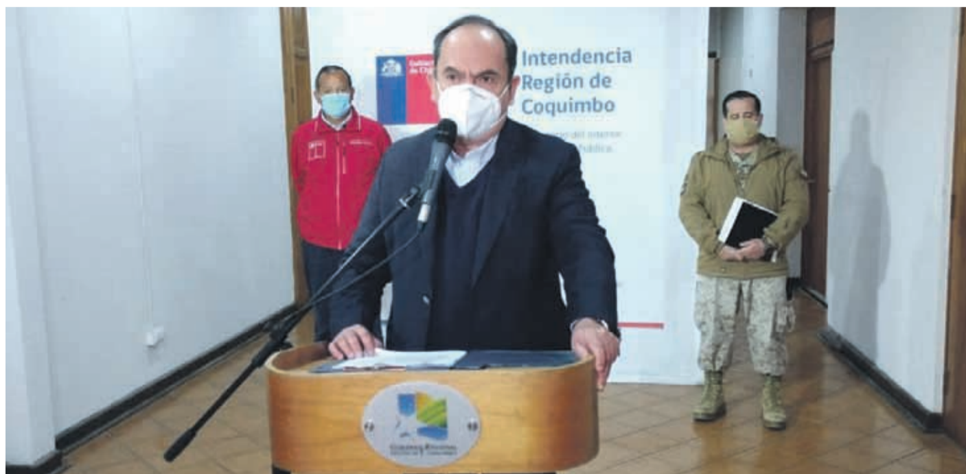
Autoridades regionales indicaron que a la fecha disponen de 7 camas UCI disponibles.

En relación al recurso de camas críticas de este miércoles, la autoridad señaló que el 90% de las camas UCI se encuentran ocupadas, habiendo disponibles 7