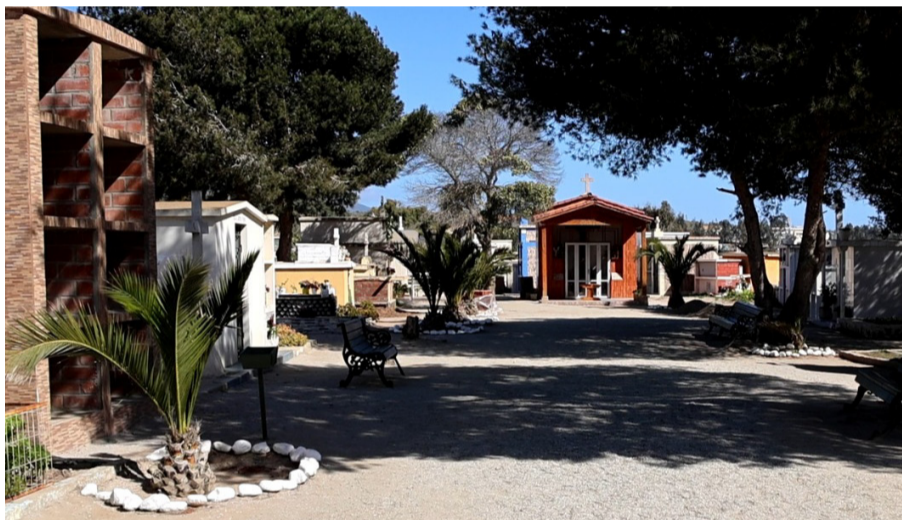
En la comuna de Los Vilos se pretenden construir alrededor de 60 nichos de emergencia para evitar el colapso del recinto municipal.

En el caso de Illapel, Los Vilos y Monte Patria, se están trabajando en proyectos para la construcción de nuevos cementerios en terrenos alternos como soluciones definitivas. En La Serena, ante la creciente demanda en los cementerios de Las Compañías y La Antena, se han implementado medidas como exhumaciones, traslados y reducciones de nichos vencidos, todo dentro del marco de las facultades otorgadas por la ley.