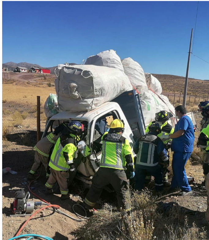
Voluntarios del Cuerpo de Bomberos de Combarbalá trabajando en el sitio del suceso del volcamiento de un camión 3 / 4 .

Al ser consultado por esto último, el Teniente aseguró que “a pesar de que el conductor iba en estado de