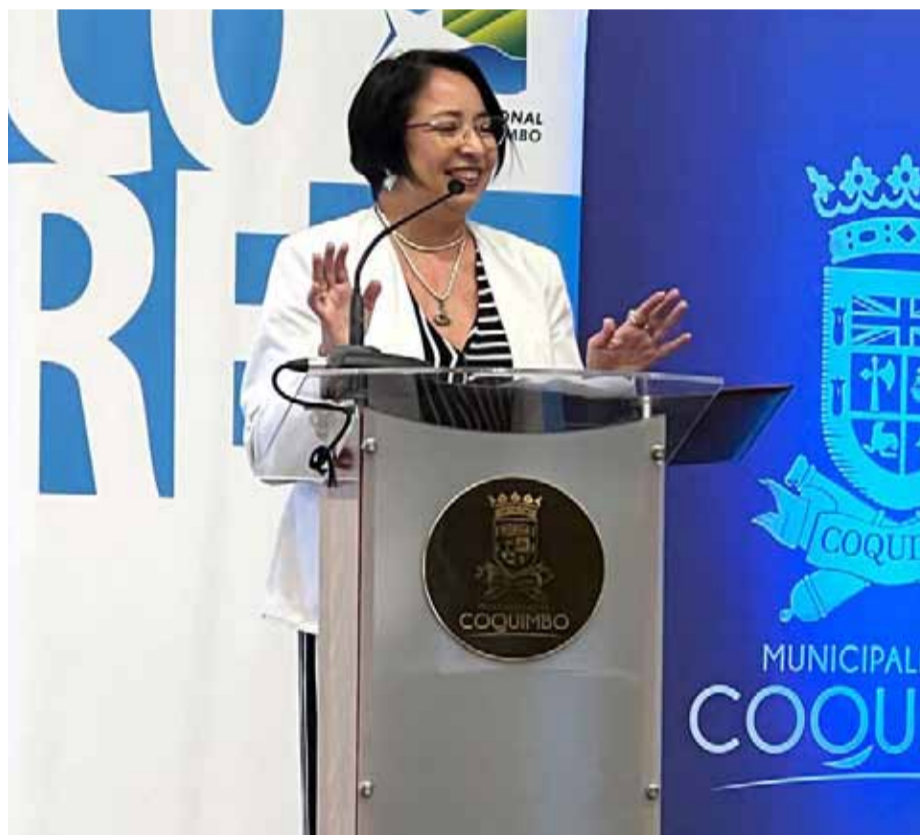
Críticas fueron algunas autoridades con la gobernadora Naranjo por realizar el llamado a postulación de fondos concursables a sólo dos semanas del plazo de cierre.

A dos semanas de cumplirse el plazo, la autoridad regional lanzó, en una ceremonia en Tierras Blancas, la primera convocatoria de los fondos concursables del GORE 2024, para organizaciones privadas sin fines de lucro, la cual, había sido anunciada el pasado 11 de marzo. La distancia con los vecinos, el esquivar las preguntas de los presentes y la baja asistencia fueron la tónica de una Krist Naranjo que pretende ir a la reelección este 27 de octubre.