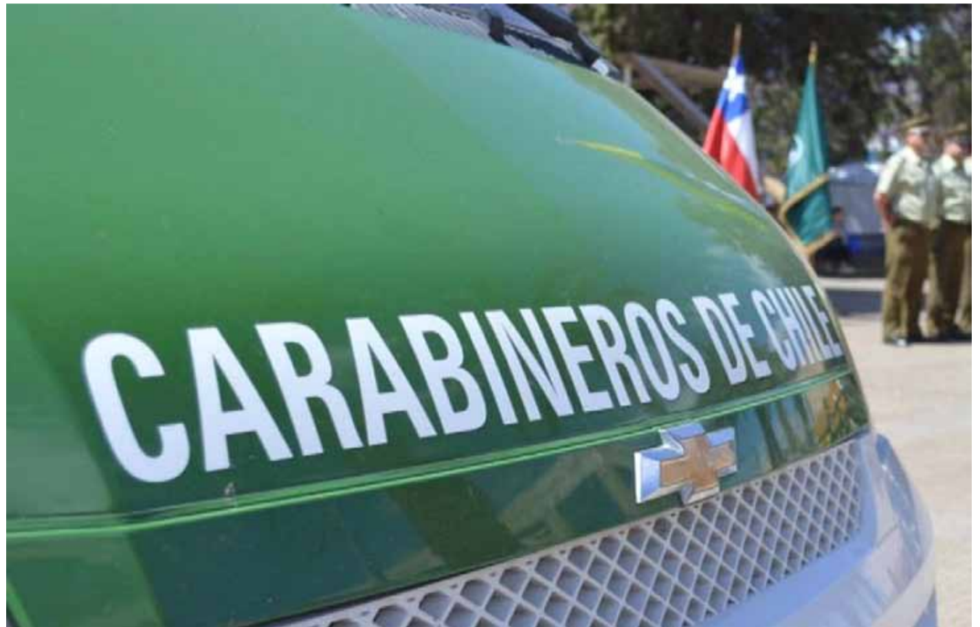
Carabineros detuvo al presunto autor del disparo, un joven de 17 años de edad, quien sería pareja de la víctima.

Cabe destacar que el presunto autor del disparo pasó a control de detención durante este lunes, pero se