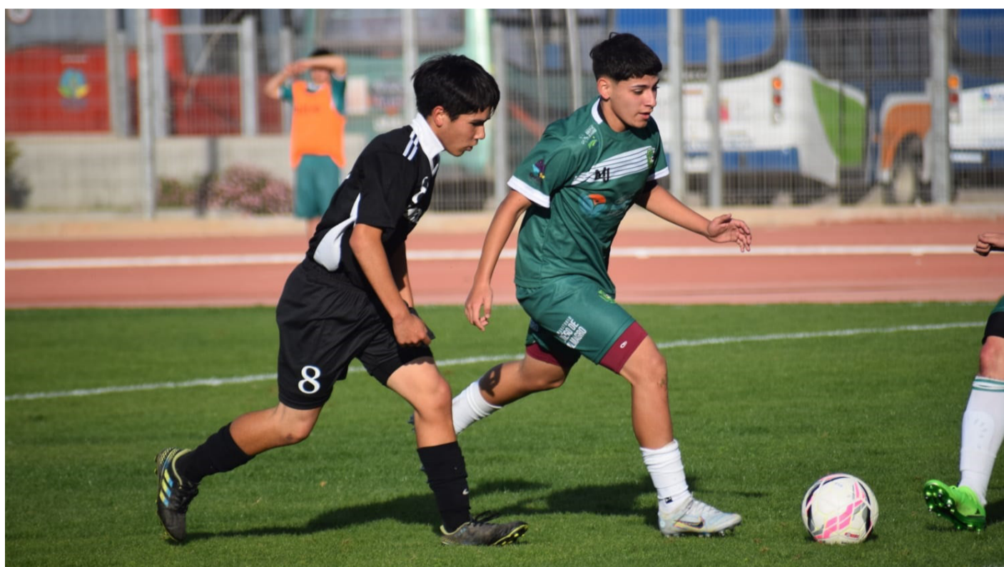
Club Deportes Ovalle enfrentó a Internacional de Santiago, en lo que fue el debut de la Liga de Proyección Chile 2023.