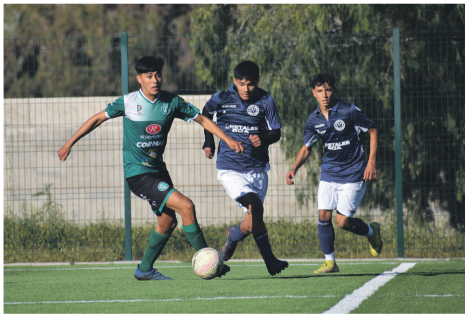
En el Estadio El Peralito se vivió el primer "Clásico del Limarí" entre FC Monte Patria y CSD Ovalle.

En el Estadio de El Peralito se enfrentaron dos equipos de la provincia, por un lado estaba el Fútbol Club Monte Patria, quien tiene su primera experiencia en este campeonato sub 18 de la Tercera División (paso que le serviría para entrar a la categoría adulta del torneo el próximo año), mientras que por el otro lado estaba un consolidado de la categoría, como es el Club Social y Deportivo Ovalle.