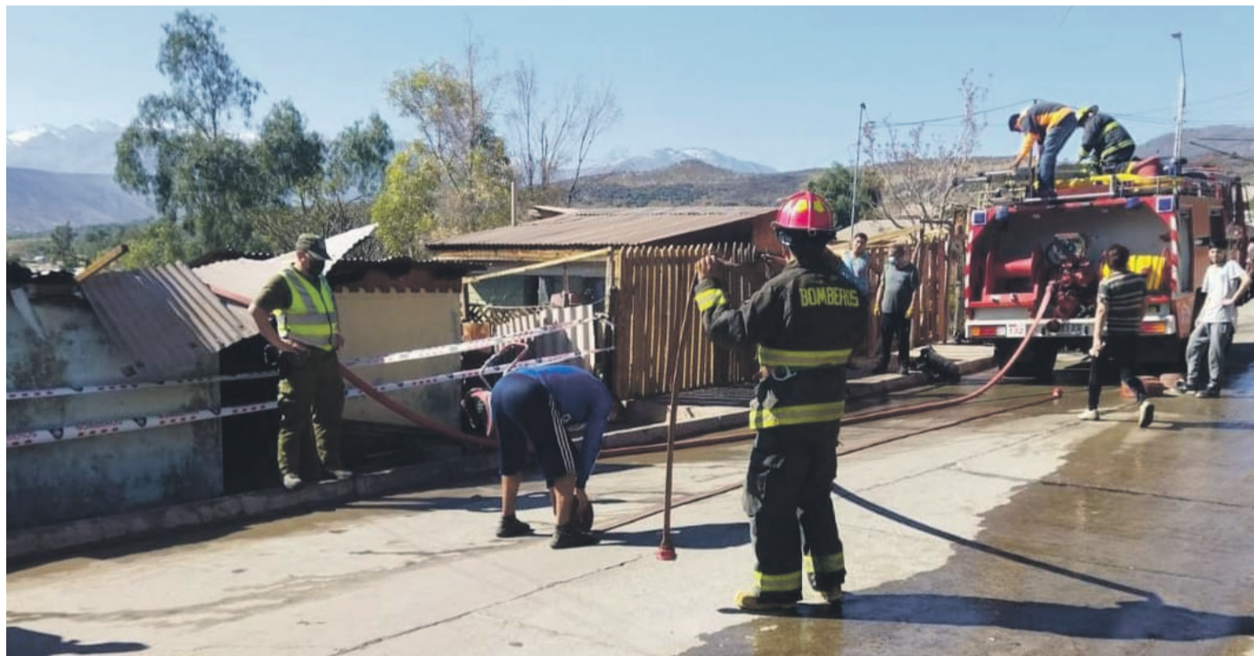
Siniestro ocurrido en la población Diego Portales de Combarbalá dejó como única víctima a un adulto mayor, quien vivía solo y no se encontraba en compañía de otras personas al momento del incendio.

"No sería raro que fueran más porque muchas personas no han realizado esta encuesta, por eso es tan importante