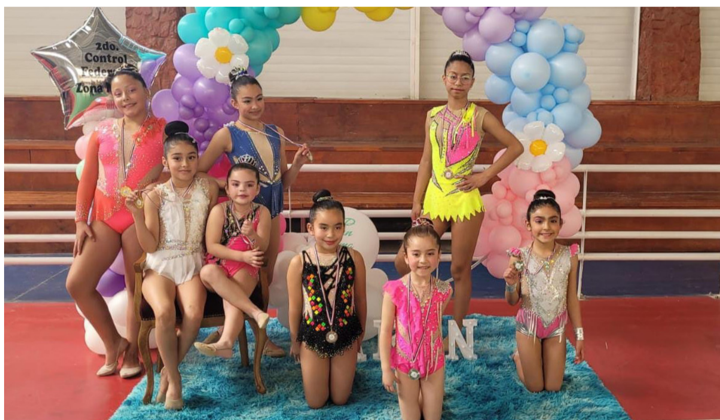
Un total de 7 gimnastas del club Jugarte clasificaron a la final nacional de Puerto Varas.

Ya dado este importante paso, queda proyectar lo que será dicha final, en donde Andrea espera que sus dirigidas puedan tener una buena presentación, “va ser un campeonato difícil, pero ojalá podamos estar entre los primeros 8 lugares, porque en gimnasia se premia del primero al octavo. No sabemos a la realidad a la cual nos vamos a enfrentar, porque solo conocemos a nuestras ‘rivales’ de la zona norte, pero ahora nos encontraremos con las mejores de la zona centro, sur y austral, entonces no sabemos cómo será la competencia, ojalá podamos traernos algún podio”, apuntó.