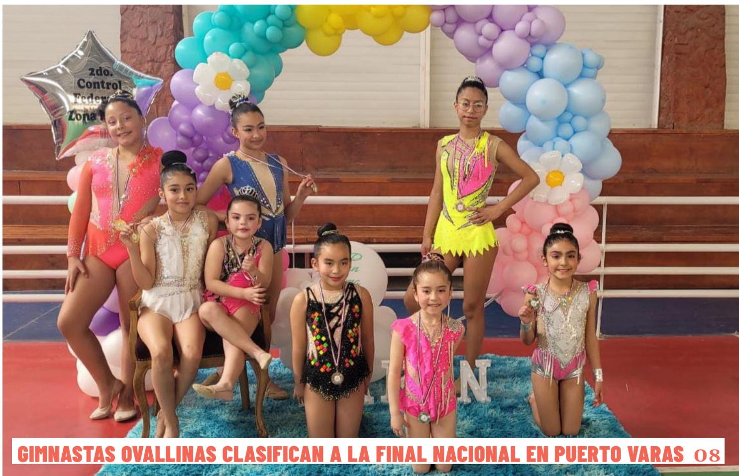
GIMNASTAS OVALLINAS CLASIFICAN A LA FINAL NACIONAL EN PUERTO VARAS 08

CAPRINOS VILLASECA SE LLEVÓ EL PRIMER Y TERCER LUGAR PROVINCIA DEL LIMARÍ DESTACA EN LA COPA AMÉRICA DEL QUESO 04