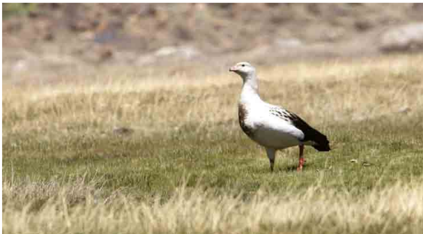
El Río Sasso en Monte Patria cuenta con diversas especies de fauna nativa.