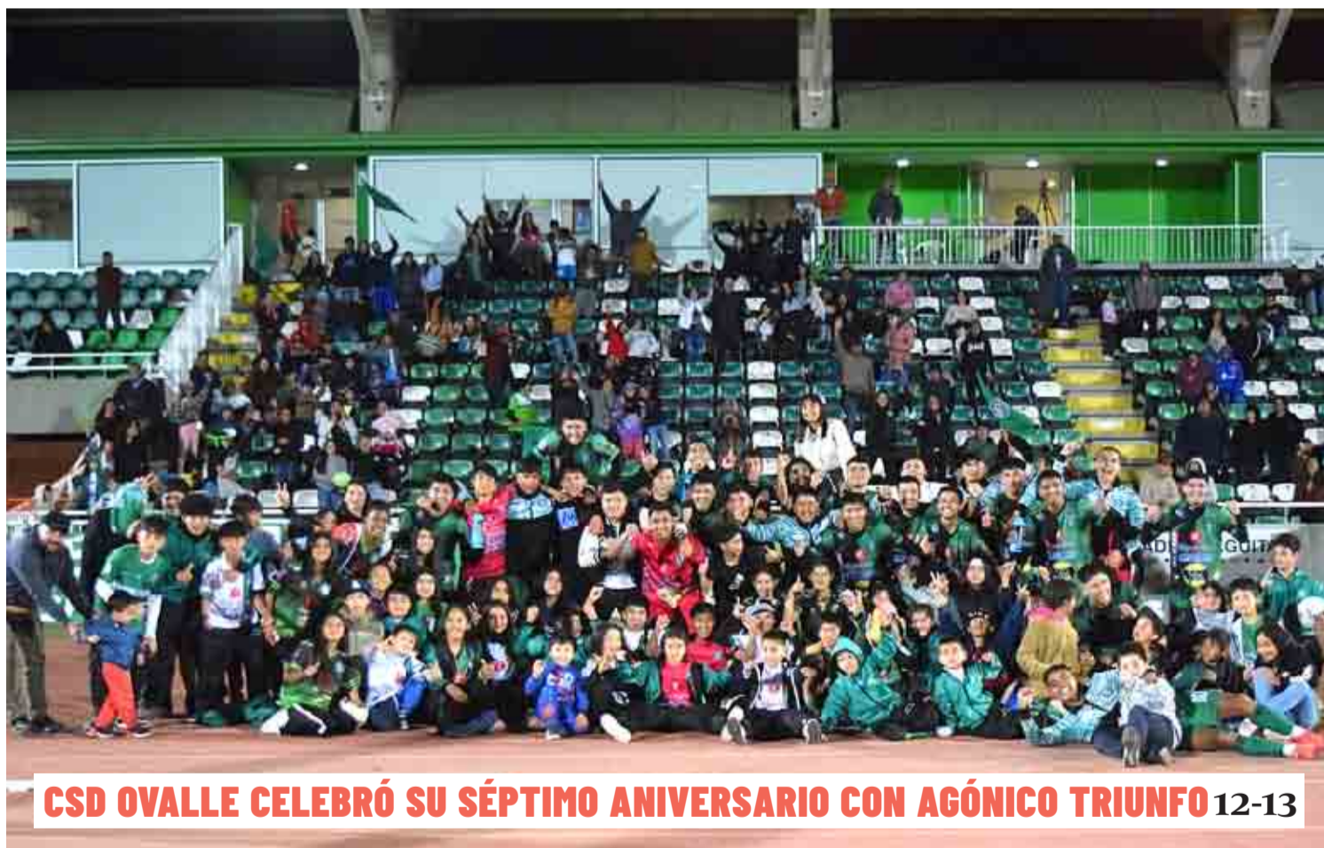
CSD OVALLE CELEBRÓ SU SÉPTIMO ANIVERSARIO CON AGÓNICO TRIUNFO 12-13

Dos meses han pasado desde que en Monte Patria se registró una masiva muerte de abejas, presuntamente generada por fumigaciones en predios cercanos. Pese a ello, las ayudas comprometidas aún no se han materializado, lo que mantiene preocupados a los afectados. 02