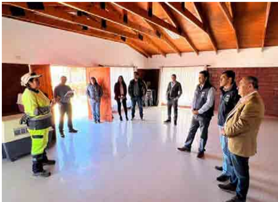
Desde la municipalidad han informado a la comunidad sobre el programa Denuncia Seguro.

La autoridad comunal señaló que "esta es una herramienta que ha dado muy buenos resultados en