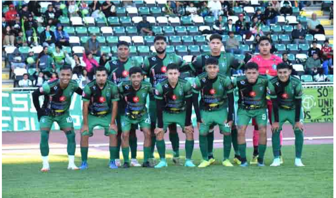
Once inicial del Club Social y Deportivo Ovalle en su partido ante Deportivo Gol y Gol.