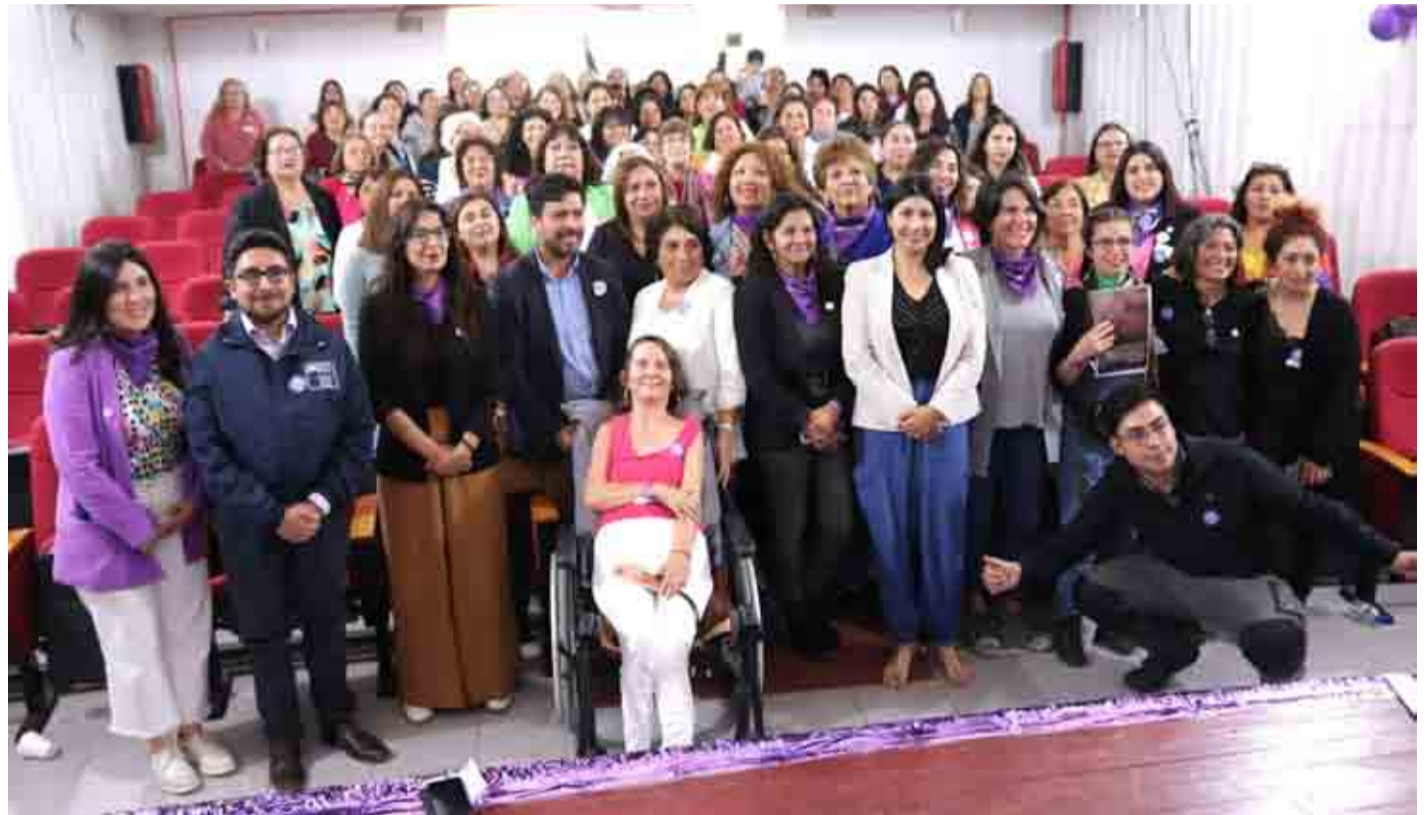
Más de 150 mujeres se reunieron en Ovalle para participar en el Día Internacional de la Eliminación de la Violencia contra la Mujer. EL OVALLINO

La Organización Mundial de la Salud (OMS) estima que alrededor de una