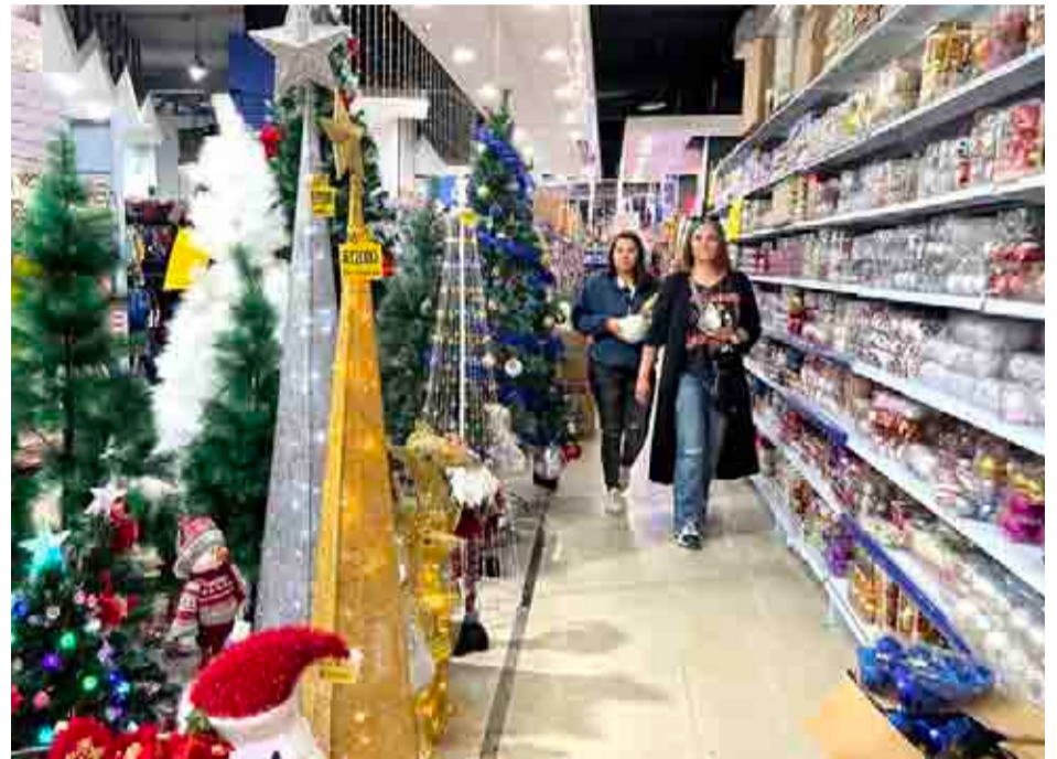
Los gastos aumentan de forma importante durante el mes de diciembre.

Por último, la académica dijo que ahorrar es una decisión y no depende de cuánto se gana o qué tan difíciles o fáciles sean las circunstancias, sino de cuánto se decide dejar de gastar ahora para invertir en proyectos de futuro.