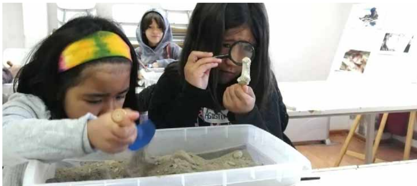
El taller "Pequeños arqueólogos del Limarí" será una de las actividades del Museo del Limarí para este mes de enero.