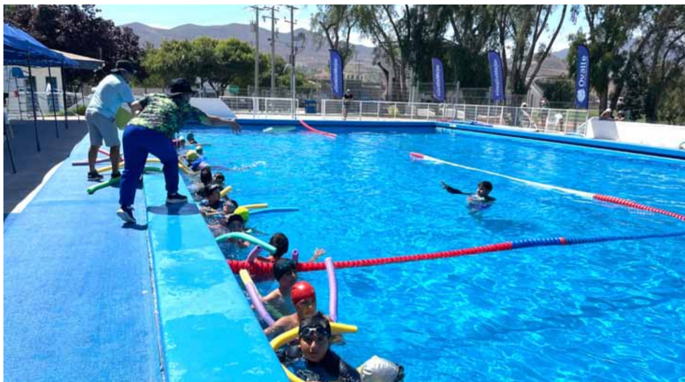
Los talleres se llevarán a cabo de martes a sábado y se dividirán en grupos etarios.