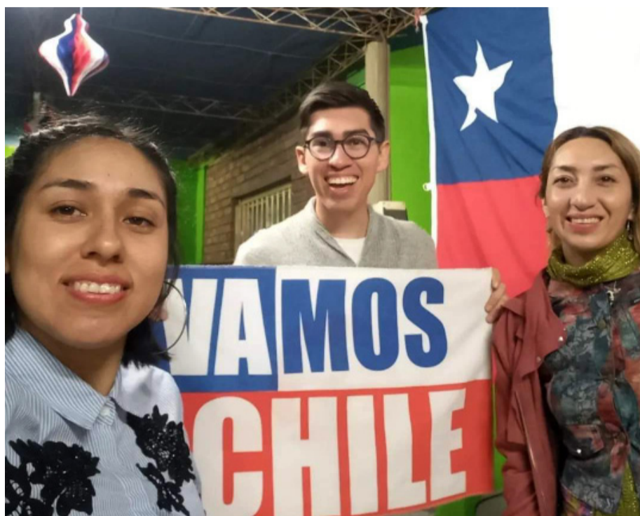
Un grupo de estudiantes universitarios chilenos de la Universidad Nacional de San Juan.