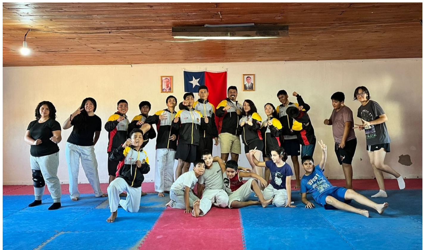
La Escuela Municipal Taekwondo Combarbalá ha obtenido positivos resultados con deportistas de diferentes edades.