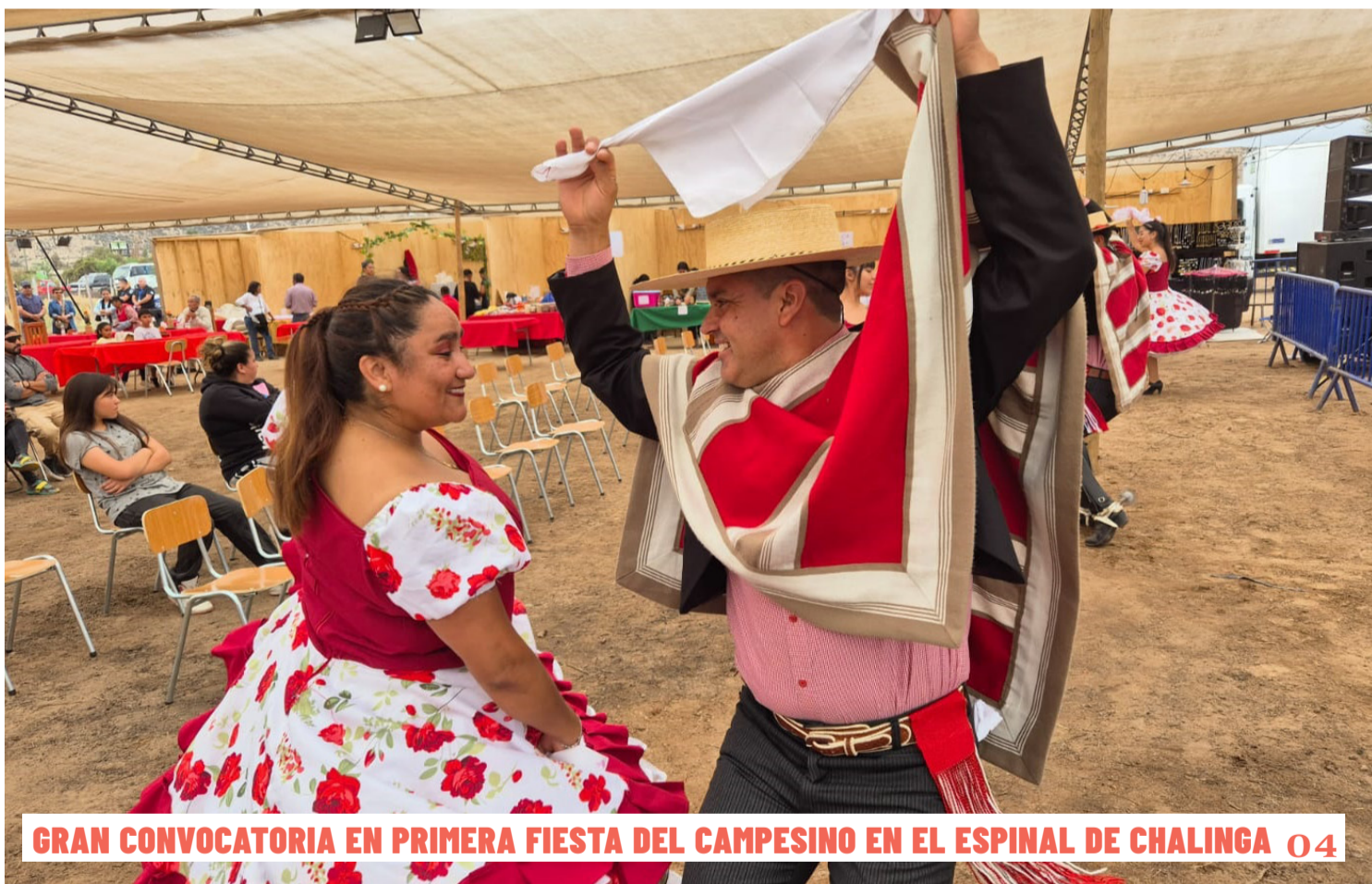
GRAN CONVOCATORIA EN PRIMERA FIESTA DEL CAMPESINO EN EL ESPINAL DE CHALINGA 04

POSITIVO INICIO DE AÑO PARA LOS COMBARBALINOS ESCUELA TAEKWONDO COMBARBALÁ LOGRA PODIOS EN LA LIGA NACIONAL