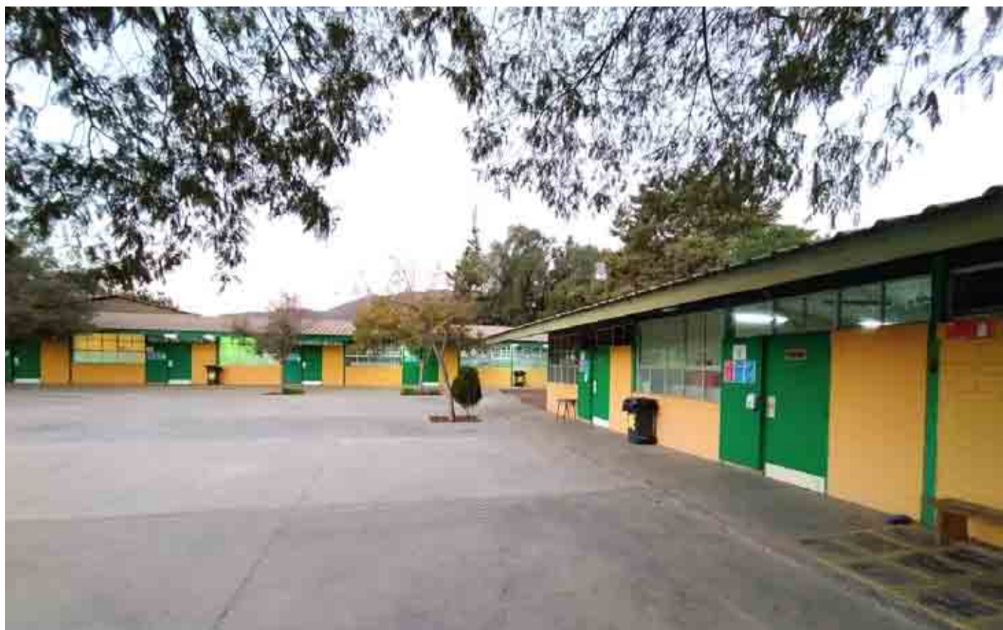
La instalación de cámaras de televigilancia es considerada como una medida que podría ayudar a controlar la ocurrencia de delitos. EL OVALINO

Los delincuentes también accedieron a las oficinas del colegio, rompiendo las protecciones externas,