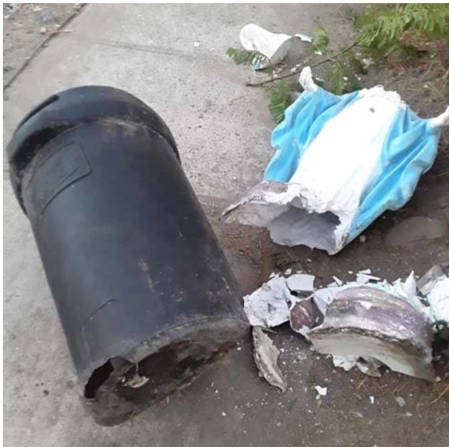
La imagen de la virgen fue encontrada rota en la calle, junto a un tarro de basura. ELOVALLINO

Esta semana, desconocidos destrozaron una imagen de la virgen en la capilla Cristo Resucitado de la Población Fray Jorge, hecho que se suma a dos situaciones similares ocurridas en la parroquia San Vicente Ferrer en marzo pasado.