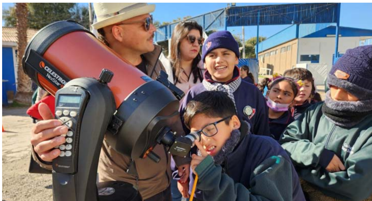
Los niños fueron los que más disfrutaron la jornada.