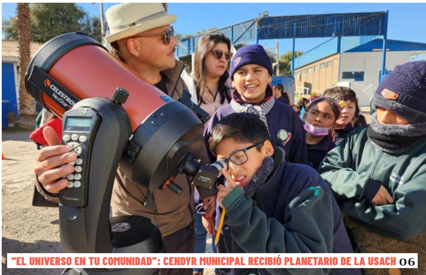
"EL UNIVERSO EN TU COMUNIDAD": CENDYR MUNICIPAL RECIBIÓ PLANETARIO DE LA USACH 06

COMUNIDAD CATÓLICA PREOCUPADA POR REITERADOS ATAQUES