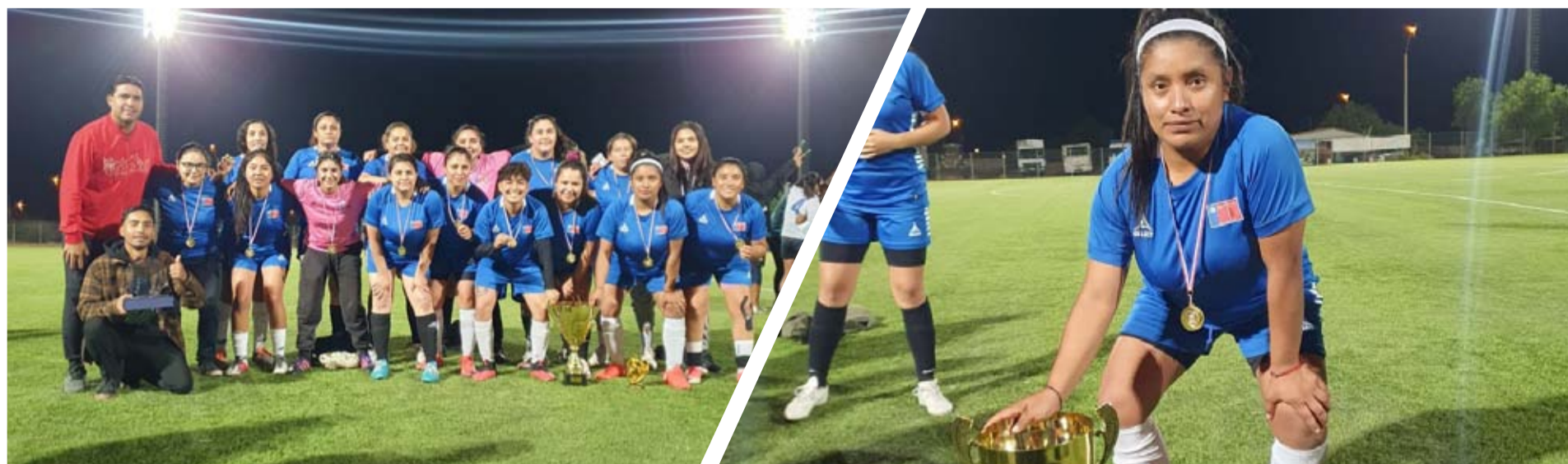
El representativo de Monte Patria fue el mejor en el hexagonal de Andacollo. AMFF