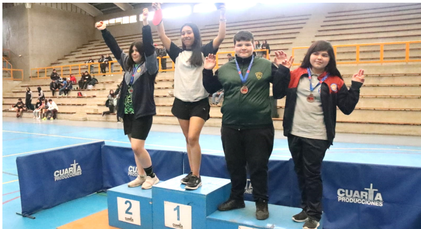
La provincia del Limarí se llevó todos los galardones en la final regional del tenis de mesa.

Desde el punto de vista técnico, el torneo llenó las expectativas de los organizadores, tanto por el número de participantes, como el nivel de juego exhibido por los tenimesistas, pues, en la llave de semifinales de