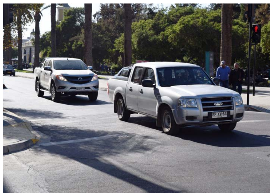
El sistema permitirá hacer una reserva de 27 cupos diarios.

Las personas que ingresen al nuevo sistema, a través de www.municipalidaddeovalle.cl tendrán que ingresar el rut, indicar el trámite a realizar y hacer efectivo el pago online. Este periodo es para realizar trámites de primera licencia, cambio de clase, renovación y agregar una nueva clase, aunque "se pondrá foco para las licencias que están con prórroga y deben ser controladas en el año 2023, que tienen fecha de vencimiento de los años 2020 y 2021" indicó el director