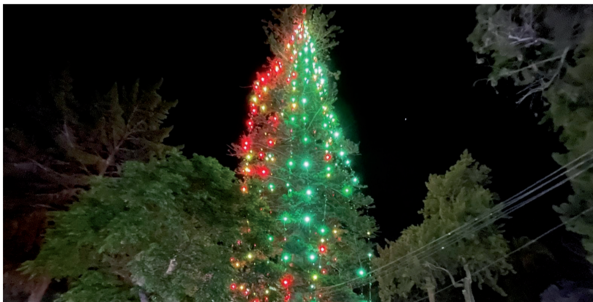
El tradicional encendido del árbol de navidad se vivió en la noche del pasado sábado 2 de diciembre.

El tradicional acto contó con villancicos, la presentación de la Fábrica de Santa y un magistral concierto de la Orquesta Sinfónica "Generaciones". Niñas y niños, adultos y tercera edad estuvieron presentes en la mágica noche que da la bienvenida al mes de diciembre