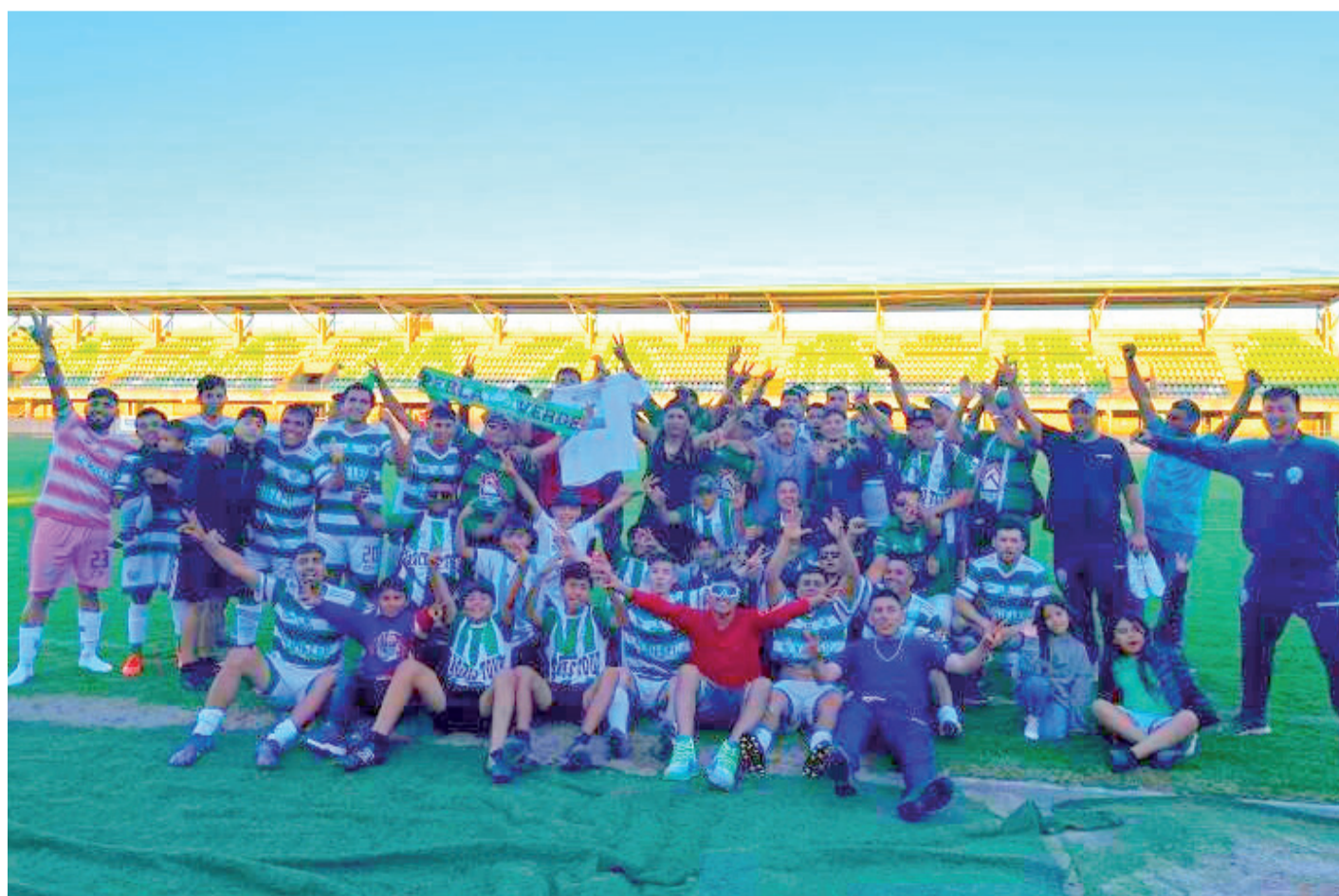
El equipo de Perla Verde celebra en el Estadio Diaguita la obtención de una nueva copa.