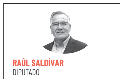
RAÚL SALDÍVAR DIPUTADO

Esta semana el Ejecutivo sufrió una gran derrota, ya que a pesar de todos los esfuerzos invertidos en demorar o impedir la realización del segundo retiro de fondos previsionales, finalmente, tanto la Cámara de Diputadas y Diputados, como el Senado aprobaron el an-