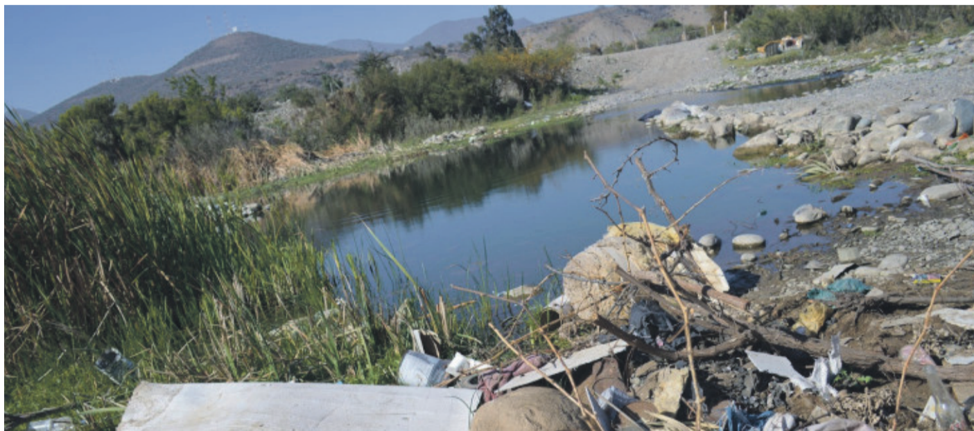
La presencia de microbasurales representa una grave amenaza para la flora y fauna.

Si bien existiría una mayor conciencia sobre el cuidado del medio ambiente y su flora y fauna, aún falta mucho por recorrer en cuanto a técnicas de reciclaje y del impacto que acciones humanas tienen en la naturaleza, como los microbasurales y el ingreso de vehículos motorizados a las playas.