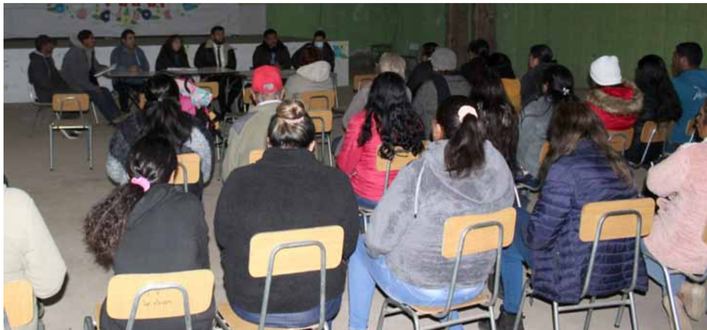
La inversión en el alcantarillado, que fue comunicada a los vecinos del sector, llega a los 300 millones de pesos.