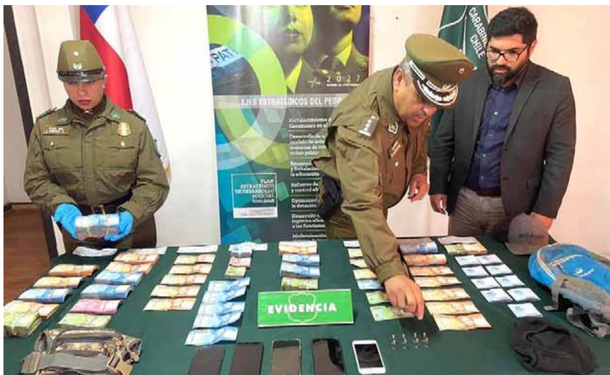
Carabineros logró recuperar la totalidad del dinero que había sido robado del servicentro.

Este lunes un grupo de delincuentes asaltó un servicentro ubicado en la salida sur de Ovalle, tras lo cual, intentaron huir por diferentes calles de la ciudad. La persecución de Carabineros fue apoyada por un dron de la delegación presidencial y las cámaras de televigilancia de la municipalidad, lo que permitió detener a cuatro de los individuos en la parte alta y al quinto sujeto, en el centro.