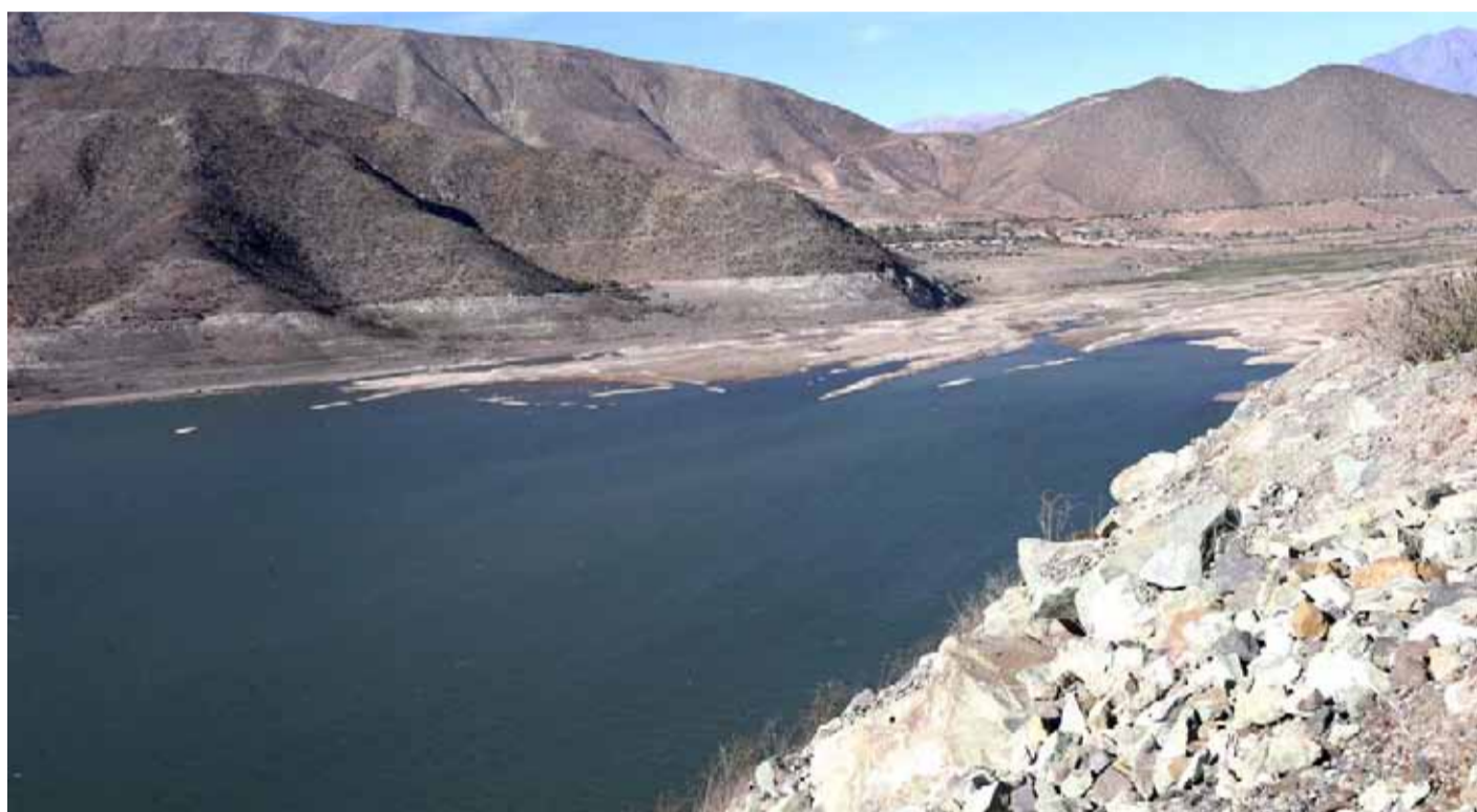
La Región de Coquimbo atraviesa una difícil situación hídrica y eso se ha visto reflejado en la situación de sus embalses.

“Estos números son un llamado de atención para todos los actores, para enfrentar juntos la escasez de agua, que es estructural en nuestra región. Todos tenemos la obligación de cuidar cada gota. Nosotros continuamos trabajando para hacer un uso más eficiente del recurso, reforzar nuestros sistemas y resguardar la continuidad del servicio para consumo humano, que es nuestra obligación”, señaló el ejecutivo.