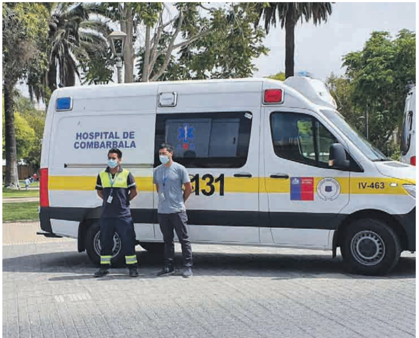
Actualmente hay 3 ambulancias disponibles para el hospital de Combarbalá.

Desde el Servicio de Salud Coquimbo explicaron que se han gestionado nuevas ambulancias para las distintas