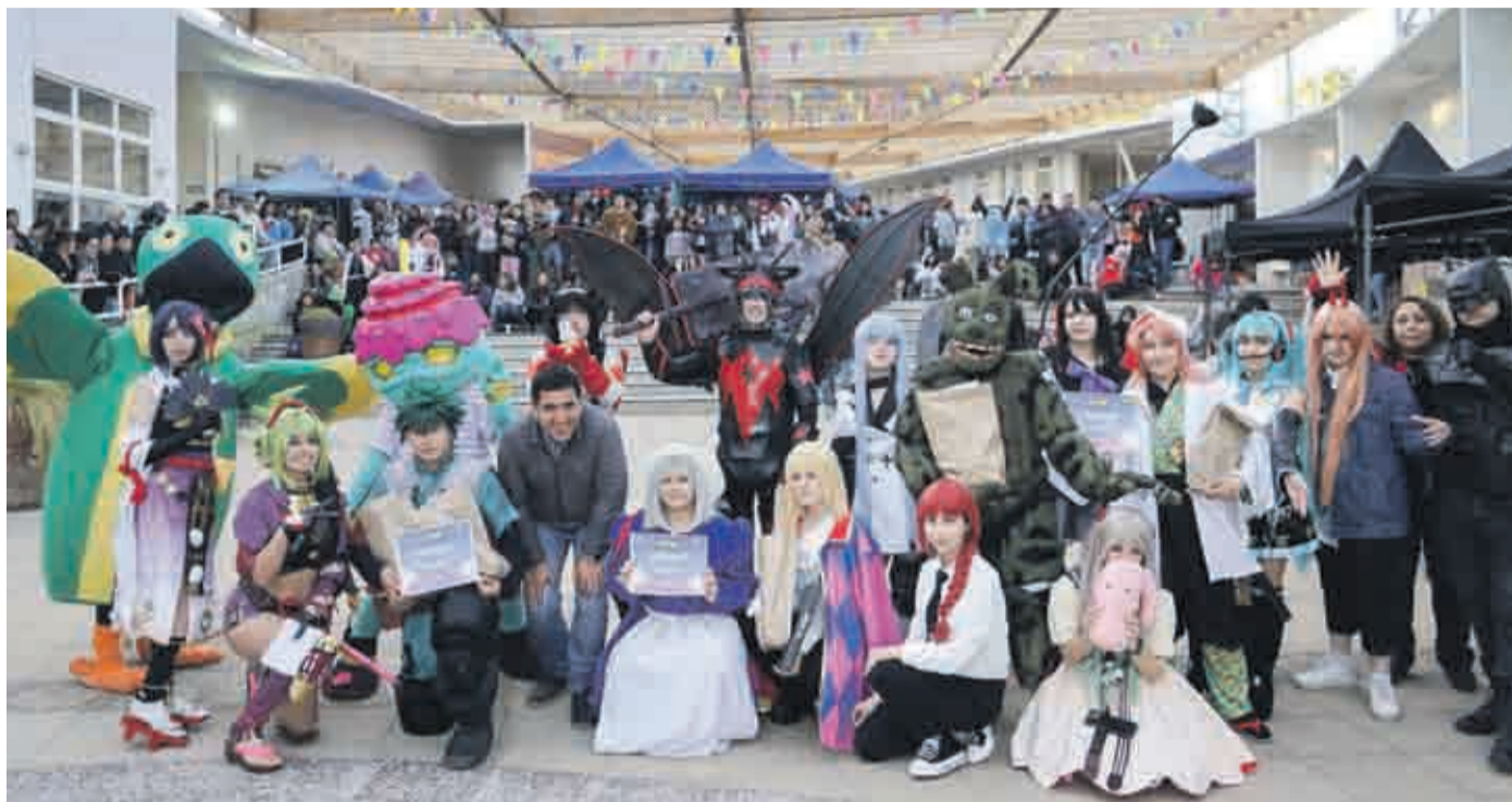
El sábado 5 de agosto se desarrolló una nueva versión del "Asian Dream Monte Patria"