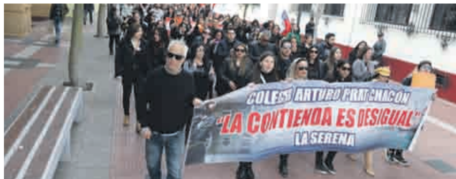
El gremio asegura que, de no existir reacción y acción urgente de parte de las autoridades de Educación, se llevará a cabo un paro indefinido.

En este sentido, tras haber finalizado el pasado jueves la segunda movilización convocada por el Colegio de Profesores, la cual se prolongó por cuarenta y ocho horas, el gremio asegura que, de no existir reacción y acción urgente de parte de las autoridades de Educación, se llevará a cabo un paro indefinido.