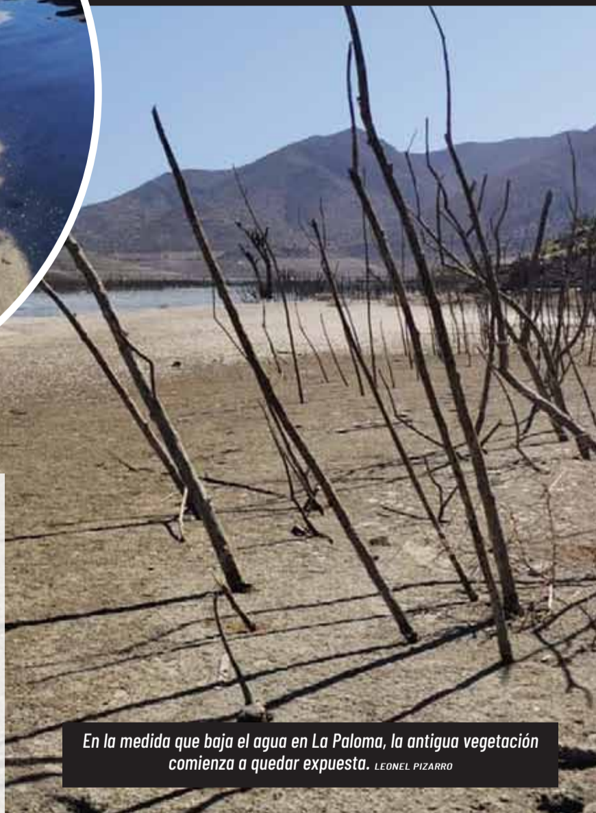
En la medida que baja el agua en La Paloma, la antigua vegetación comienza a quedar expuesta. LEONEL PIZARRO

Australia en la zona del Pacífico, lo que bloquea las tormentas hacia la zona centro norte de Chile. Esta oscilación de la mancha cálida y otros fenómenos que se superponen, deberían ir en retirada, pero es bastante difícil decirlo con certeza, lo que se suma al cambio climático. Entonces no hay muy buenas esperanzas a futuro. Además los modelos climáticos indican que esta zona será más seca de lo que ya es, transitando hacia un clima más árido”, concluyó.