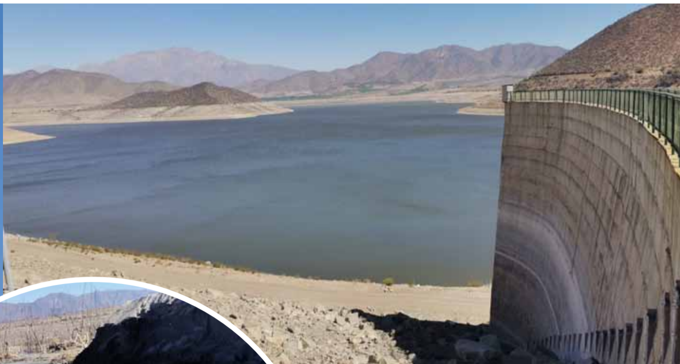
El embalse La Paloma, en la comuna de Monte Patria, sólo está al 6% de su capacidad. Algunos peces intentan sobrevivir en la escasa agua que queda en el embalse. LEONEL PIZARRO

“Las investigaciones han dado un poco de luz que puede ser por la mancha cálida que hay frente a