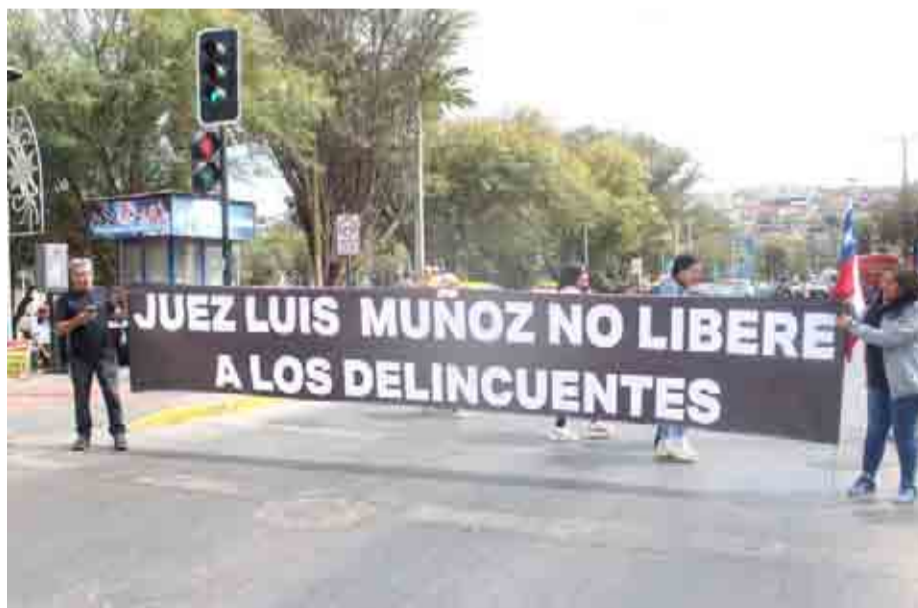
En medio de la manifestación hubo un especial llamado a la justicia