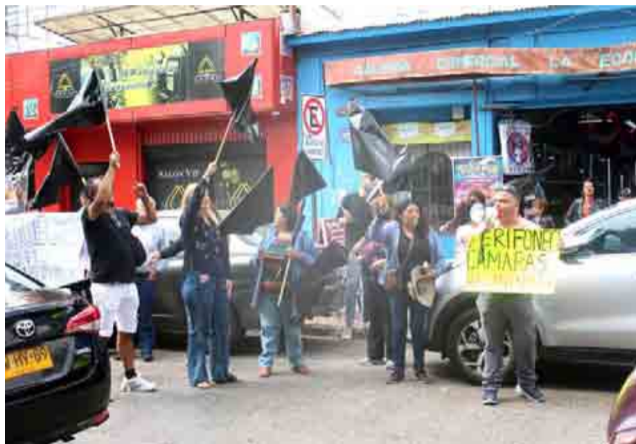
La protesta de los comerciantes recorrió el centro de Ovalle.

Los locatarios y vendedores formales del centro realizaron esta manifestación para denunciar los constantes robos de los que son víctima a diario. De esta manera exigieron soluciones concretas y mayor justicia, en consideración de los delincuentes que fueron recientemente detenidos, pero inmediatamente liberados.