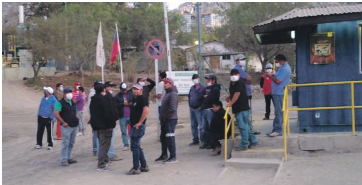
Con mascarillas y resguardos, los trabajadores se movilizan.