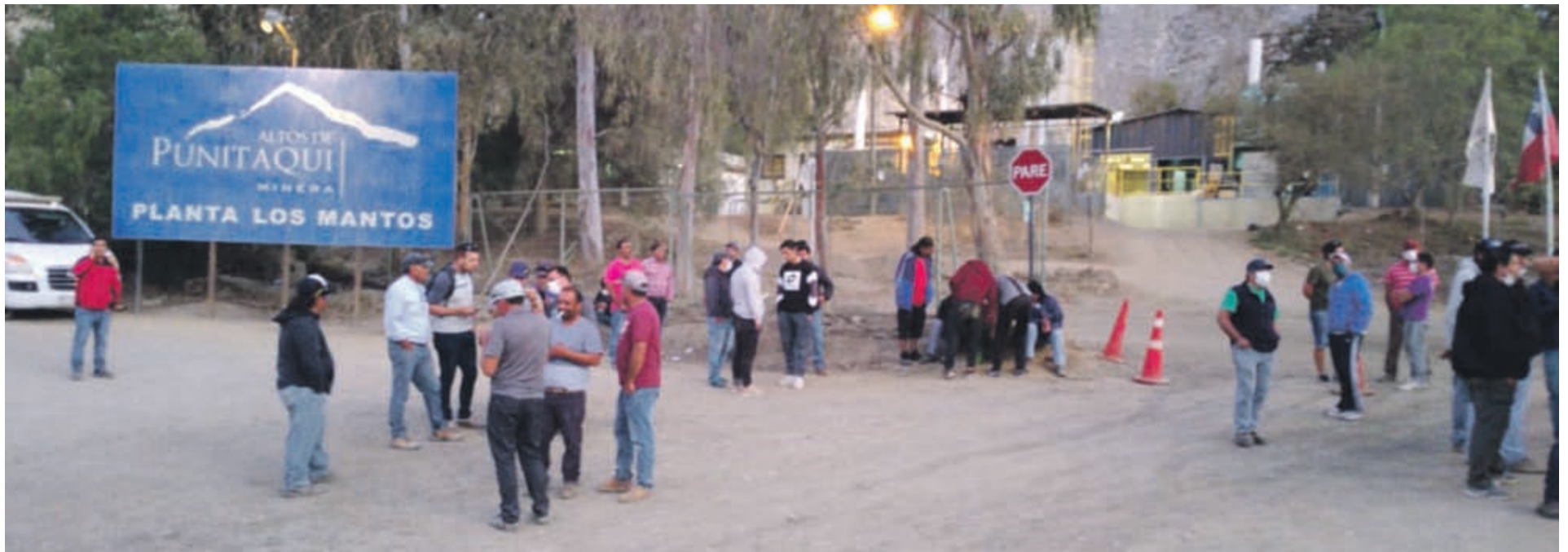
Los trabajadores desvinculados y sin el pago de sueldo del mes de marzo, se encuentran movilizados en la planta Los Mantos de la comuna de Punitaqui.