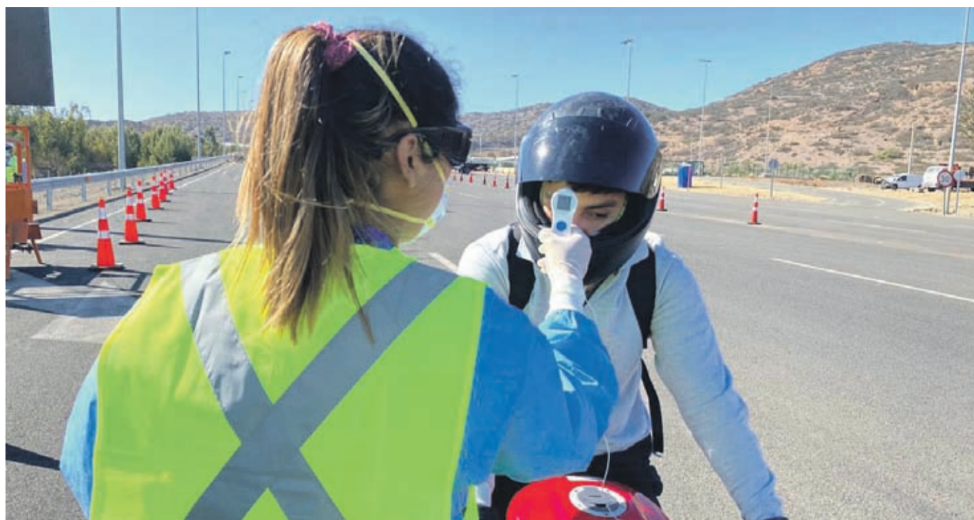
Los controles sanitarios en los ingresos a cada comuna aumentarán desde este miércoles.