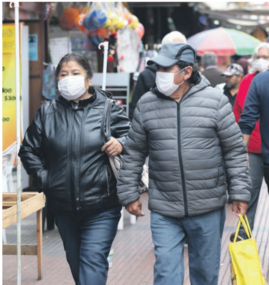
La región se encuentra en Fase 3 de la pandemia.

“Las medidas adoptadas para este fin de semana santo son tremendamente estrictas, las que pedimos a la gente poder cumplir en su cabalidad, de