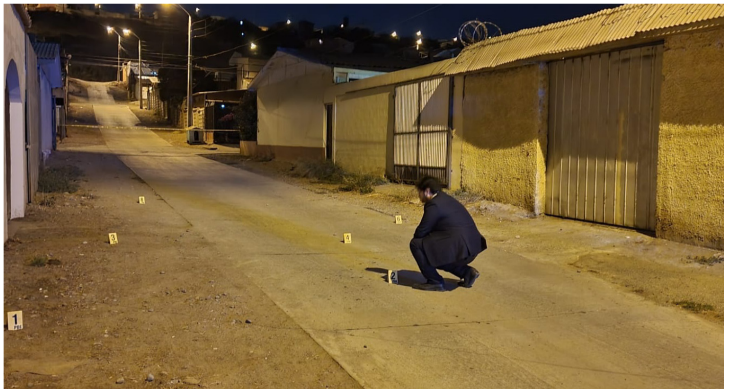
La Brigada de Investigación Criminal de Ovalle realiza las diligencias del caso.

En este contexto, dirigentes vecinales del sector comentan su preocupación por esta clase de hechos que se han vivido en el lugar, "esta fue una situación bastante violenta, los