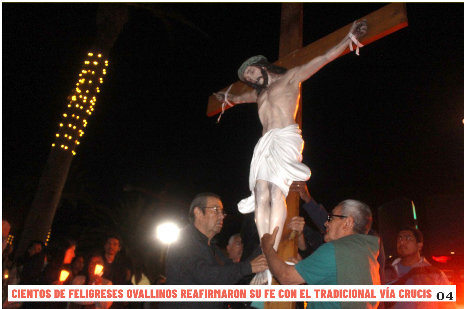
CIENTOS DE FELIGRESES OVALLINOS REAFIRMARON SU FE CON EL TRADICIONAL VÍA CRUCIS 04

Un grupo de antisociales atacó a una familia a las afueras de su domicilio en la Población Limarí, para intentar quitarles su camioneta. Los delincuentes no lograron llevarse el vehículo, pero en el forcejeo hirieron al padre y a su hijo. Esta situación genera temor y preocupación en los vecinos del sector, quienes exigen que se tomen medidas de seguridad. 03