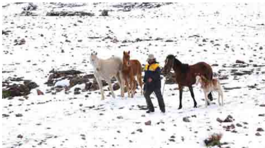
Se espera que en el Limarí caigan unos 20 cm de nieve en la cordillera.

El experto también enfatiza en que "las lluvias serán cortas, partiendo desde la tarde de este martes 7 hasta el miércoles 8 en la madrugada, con montos que podrían llegar a 30 mm en Choapa, 20 a 35 mm en Limarí, en la zona costera de Elqui (conurbación La Serena-Coquimbo) entre 5 y 7 mm, y en algunas comunas precordilleranas, hasta 10 mm aproximadamente".