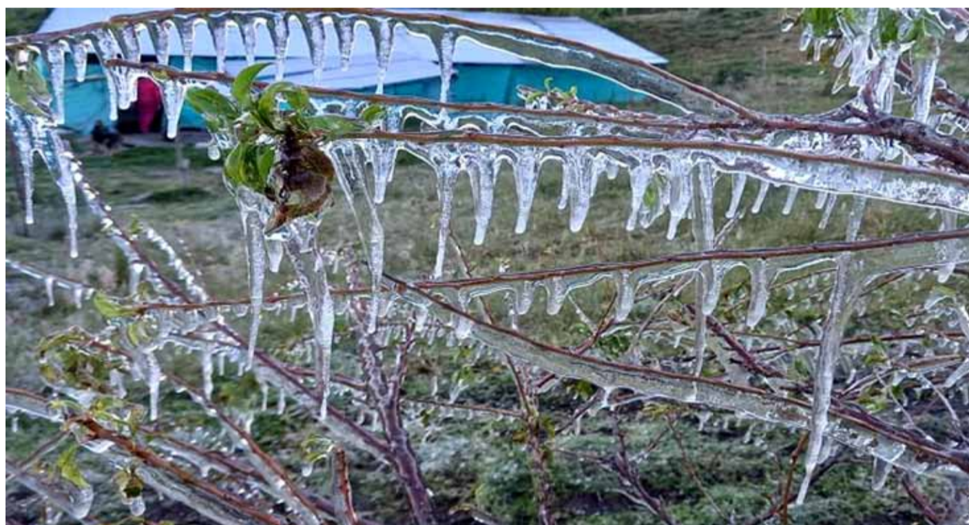
Las primeras heladas del año ya se registraron en la Provincia del Limarí, afectando a quienes viven de la agricultura.

Por su parte, el Representante de la Cooperativa de hortaliceros “Tradiciones del Limarí” de El Tomé