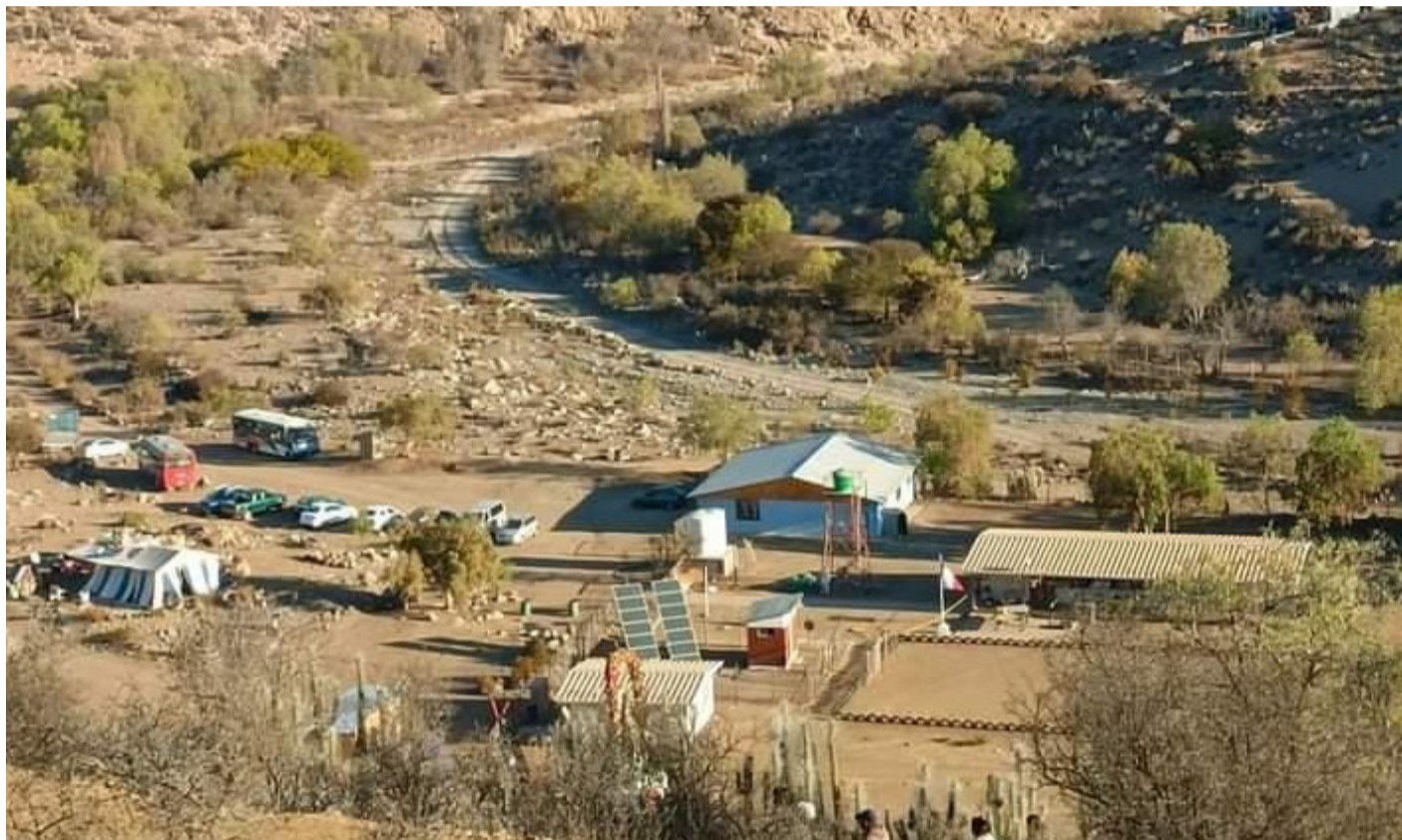
En la imagen se aprecian la sede deportiva de Quebrada Seca de Sotaquí (edificación azul) y la copa de agua comunitaria.

Sumado a esto, el dirigente sostuvo que “alertamos al actual alcalde respecto al mal estado de los caminos,