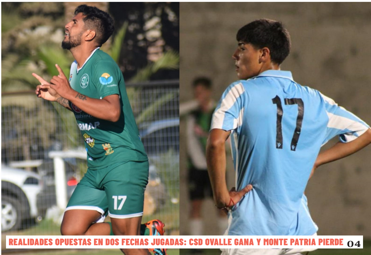
COMUNICACIONES CSDO Y MUNICIPIO MONTE PATRIA