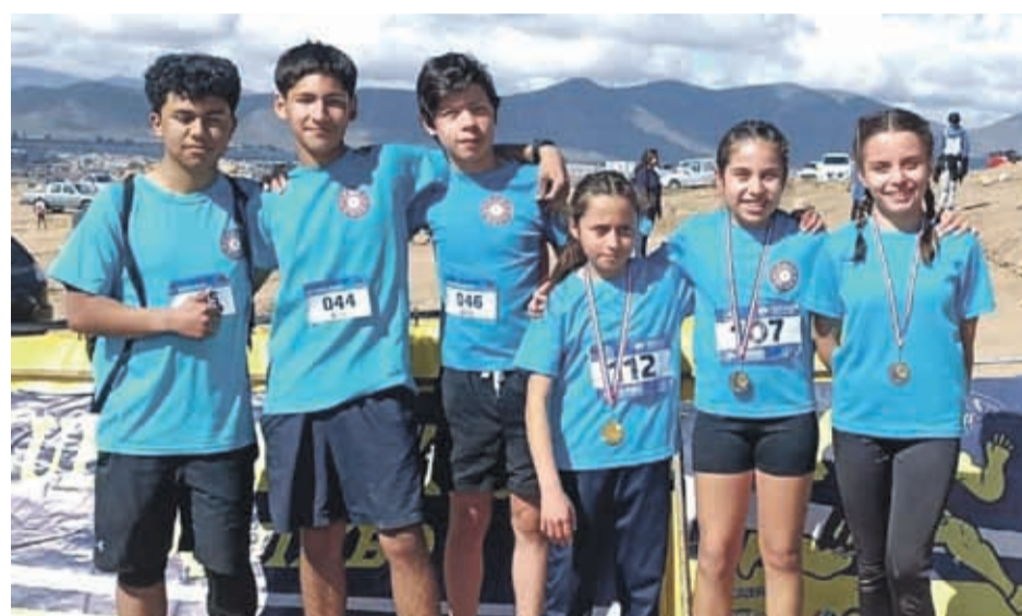
Sangre Diaguita obtuvo medallas con sus jóvenes atletas.

Por su parte, el Club Atlético Sangre Diaguita también tuvo una buena