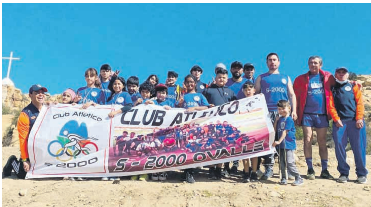
El Club Atlético S-2000 tuvo participantes juveniles y "master".

La gran mayoría de los participantes fueron de La Serena y Coquimbo, aunque cabe destacar que también hubo algunos representantes de Santiago e incluso una corredora del extranjero.