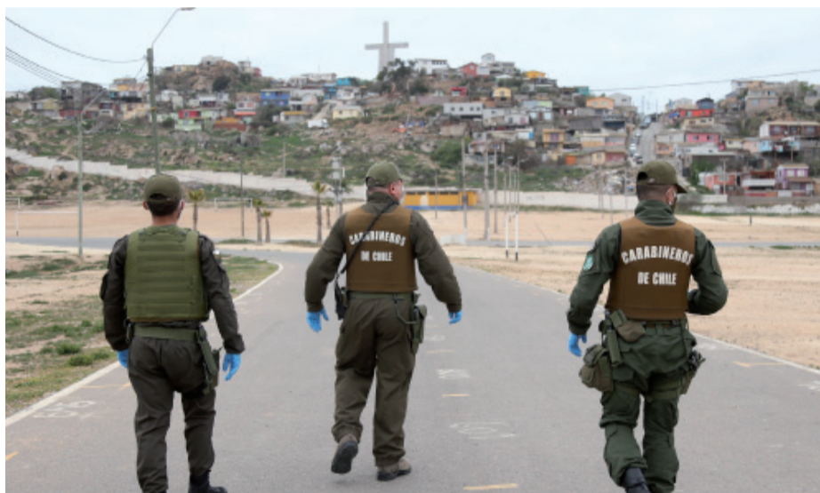
Si bien las cifras indican que han disminuido los homicidios, la violencia de los delitos es cada vez más cruda.

Diputados, Diputadas y Senadores de la zona apuntan a que se debe dejar de lado los colores políticos y trabajar en combatir el crimen organizado para aumentar la sensación de seguridad de la población, la que ha estado marcada por los últimos crímenes ocurridos en la región, algunos incluso a plena luz del día.