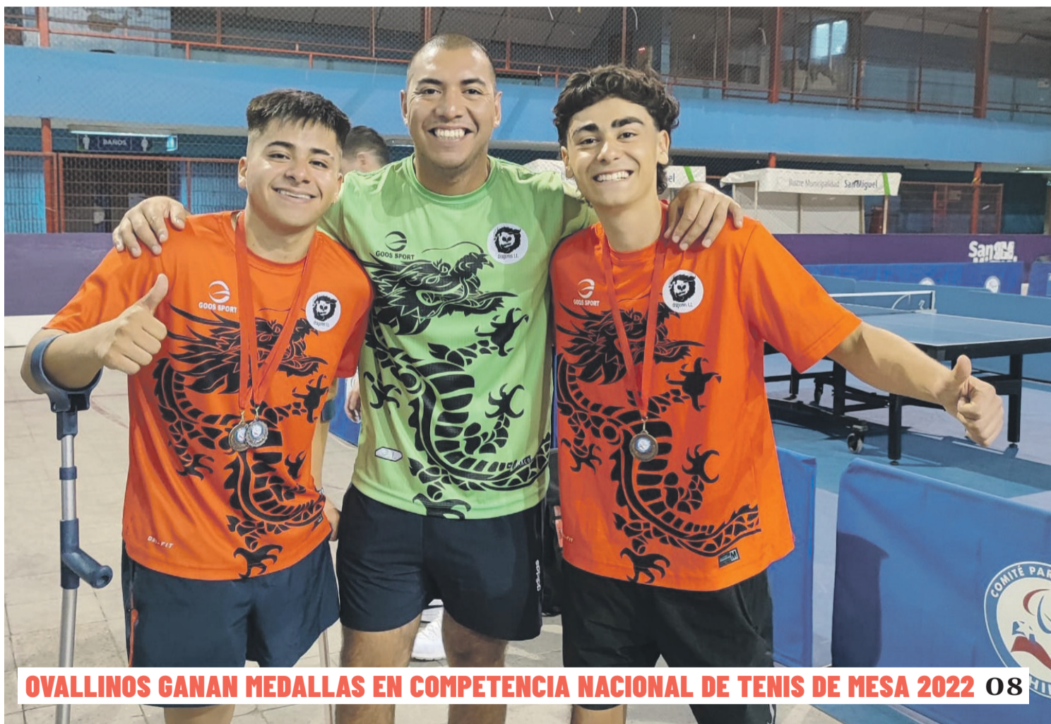
Ovallinos ganan medallas en competencia nacional de tenis de mesa 2022 08

REGANTES DE RECOLETA INAUGURAN PROYECTO 07