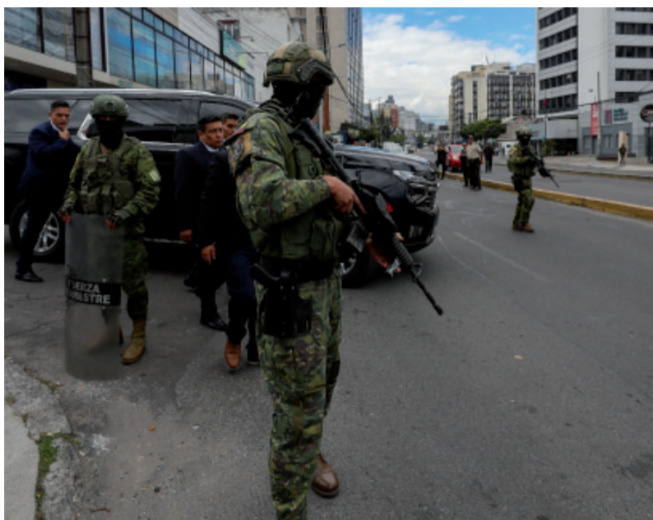
Desde este martes comenzó una escalada de violencia sin precedentes en Ecuador.