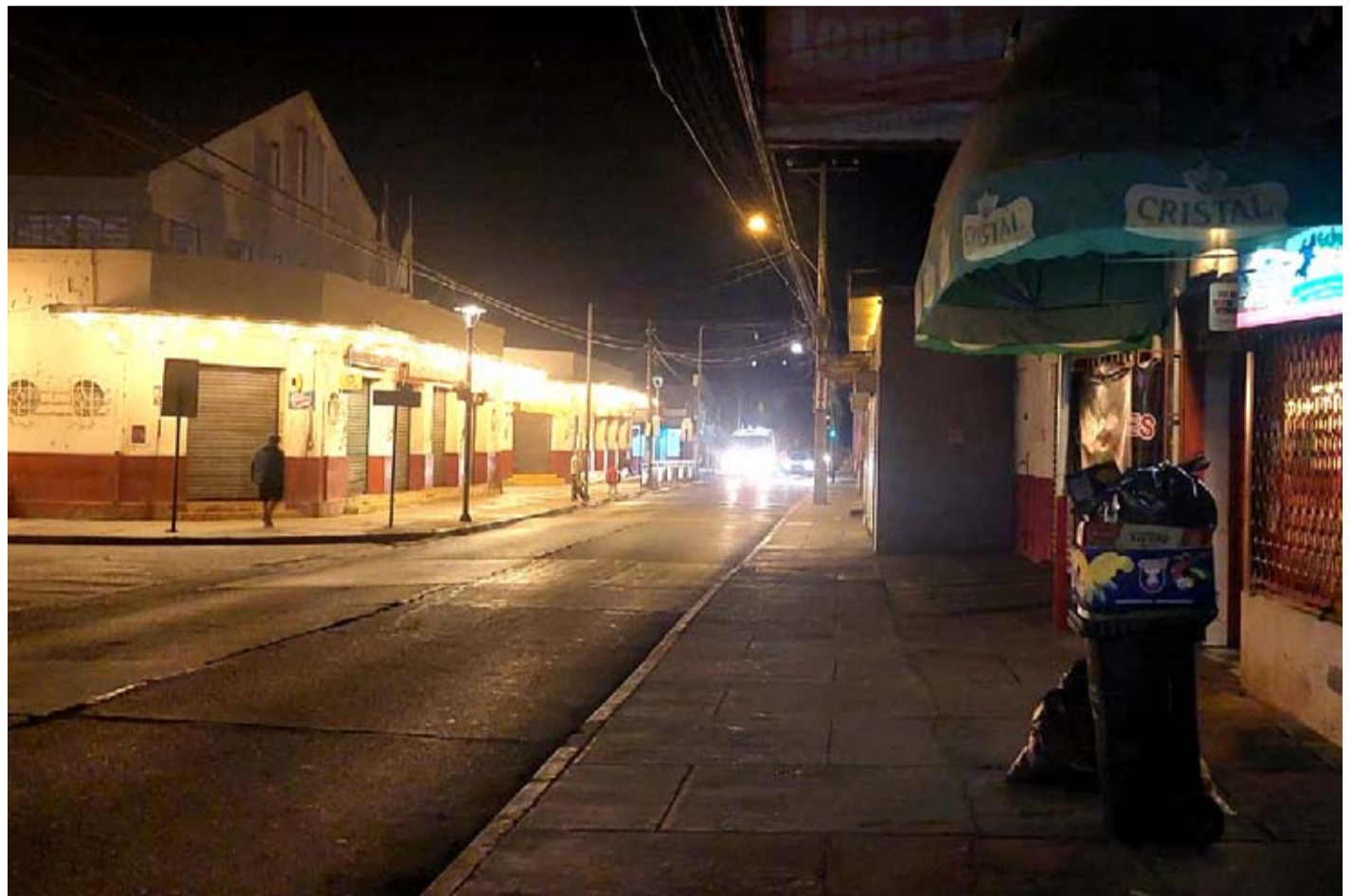
El Mercado de la capital lmarina y el sector de Barrio Independencia se ha visto muy afectado por la delincuencia en el último tiempo.