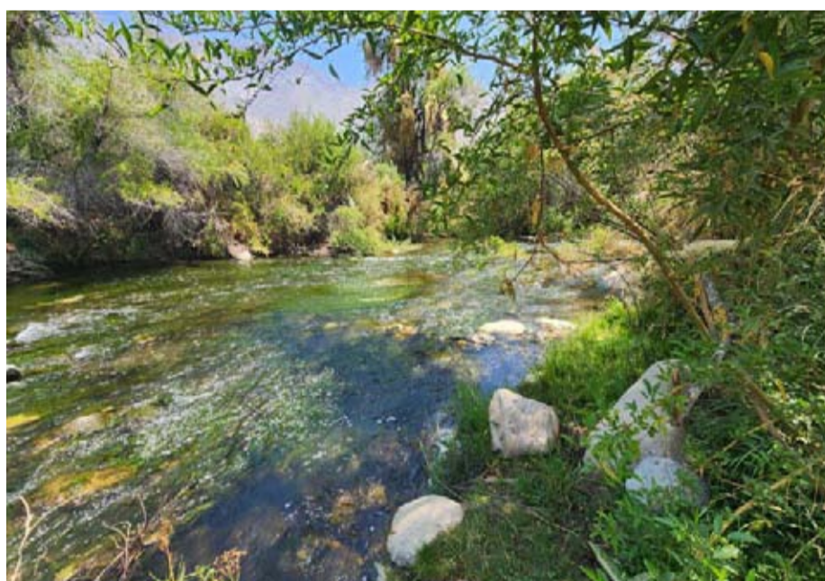
El tramo del río Grande que fue solicitado para declararlo como humedal presenta una gran diversidad de flora y fauna.