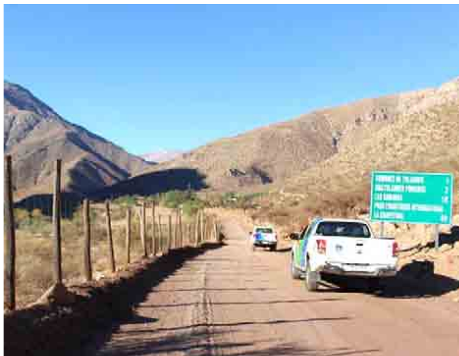
El paso La Chapetona se encuentra ubicado en la comuna de Monte Patria.

Si bien se reconocen algunos beneficios económicos que podría traer consigo una inversión en este paso, los consejeros regionales limarinos manifiestan que cualquier decisión no puede pasar por alto la opinión de los habitantes de la comuna de Monte Patria. En ese contexto, el paso de Agua Negra se mantiene como la prioridad dentro de la Región de Coquimbo, al estar también más avanzado en cuanto a infraestructura y consenso político.