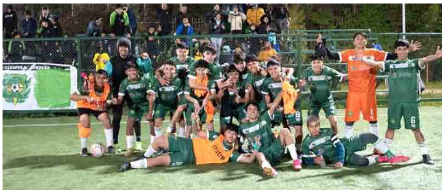
Un buen grupo de hinchas ovallinos acompañó al CDO en su partido en Santiago.