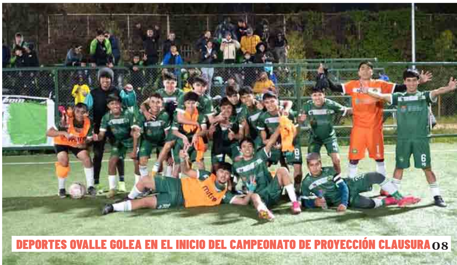
DEPORTES OVALLE GOLEA EN EL INICIO DEL CAMPEONATO DE PROYECCIÓN CLAUSURA 08

Los apicultores afectados afirman que esta situación se originaría por las fumigaciones que se realizan en los fundos agrícolas aledaños a las colmenas. Las autoridades, por su parte, tomaron muestras para determinar eventuales responsabilidades y comprometieron ayudas. 02