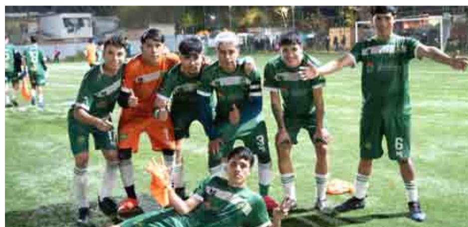
Los jóvenes talentos de Club Deportes Ovalle celebraron el triunfo obtenido en la Región Metropolitana.

Desde el histórico club dejan invitada a la comunidad ovallina a que asista al estadio este domingo, para acompañar al equipo.