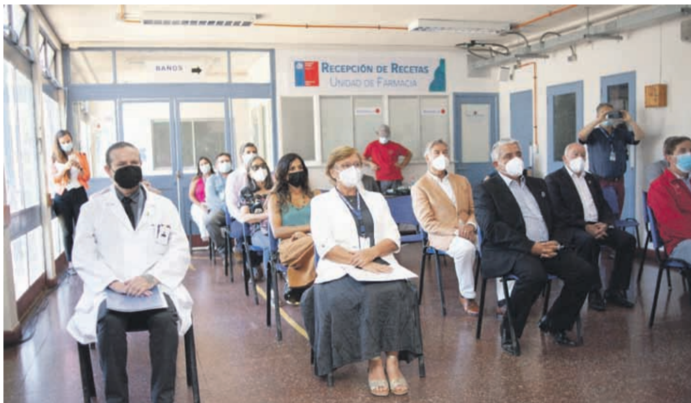
Ex hospital: Ceremonia de traspaso ex Hospital Dr. Antonio Tirado Lanás a municipalidad de Ovalle.

Con respecto al recinto, por más de 50 años este fue muy significativo en la atención de pacientes de la Provincia del Limarí y de la Región de Coquimbo, siendo incluso habilitado como un hospital de contingencia que permitió reforzar la Red Asistencial en el momento más duro de la pandemia.