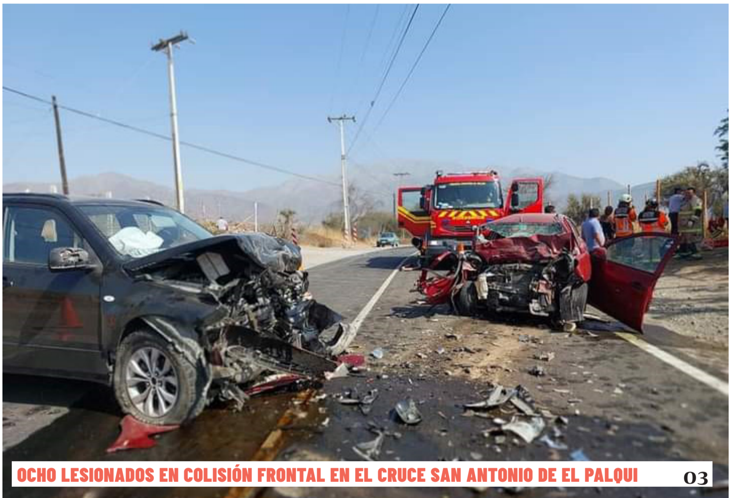
OCHO LESIONADOS EN COLISIÓN FRONTAL EN EL CRUCE SAN ANTONIO DE EL PALQUI