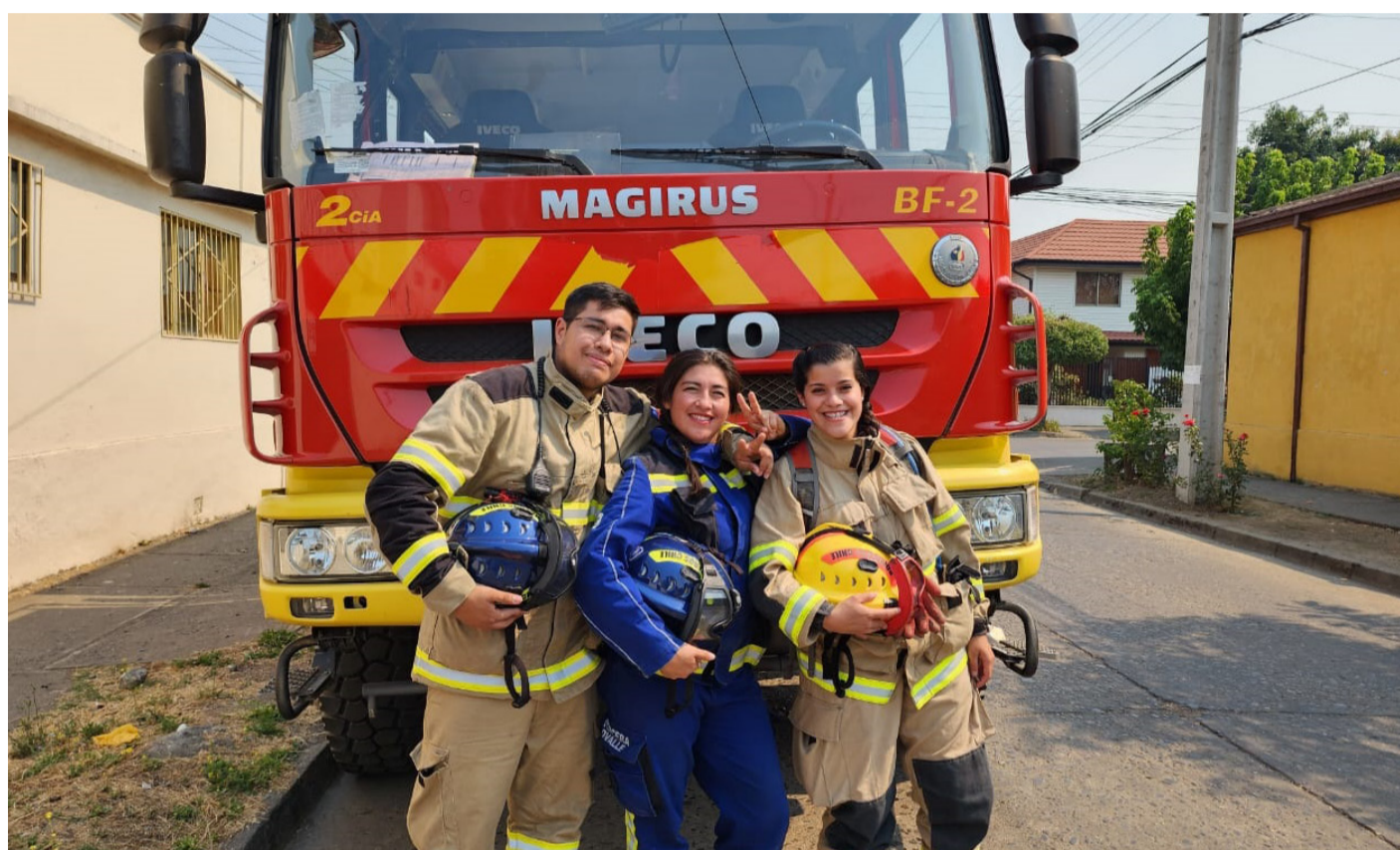
Los tres miembros del equipo de la Sala de Emergencias forman parte de la delegación de Bomberos que relevó a la primera avanzada