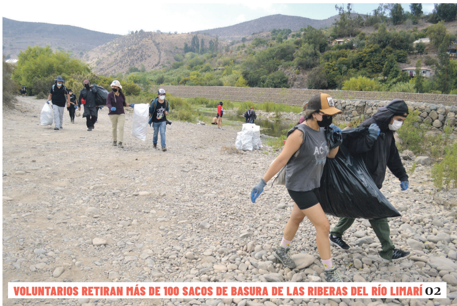
VOLUNTARIOS RETIRAN MÁS DE 100 SACOS DE BASURA DE LAS RIBERAS DEL RÍO LIMARÍ 02

MÁS DE 26 MIL PLANTAS EN LO QUE VA DE AÑO