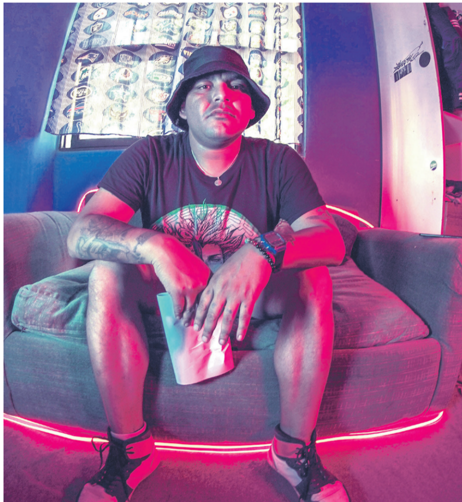
Modays lanzó el video de Combate la Vida, que corresponde al primer tema de su segundo disco.

"Yo este video lo hice porque este año retomo mi música, viene incluido en un disco que estamos trabajando con mi productor", sostuvo el artista, quien ya está trabajando en los temas que irán incluidos en la producción. "El disco lo pretendemos sacar a fines de agosto, entonces este es como el puntapié del disco", agregó.