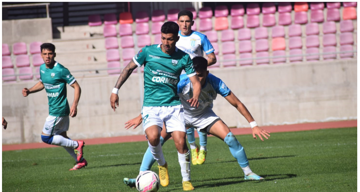
Provincial Ovalle fue superior en el juego ante Unión Compañías, partido disputado en el Estadio La Portada.

Al minuto 60 Unión Compañías logró igualar gracias a una gran jugada