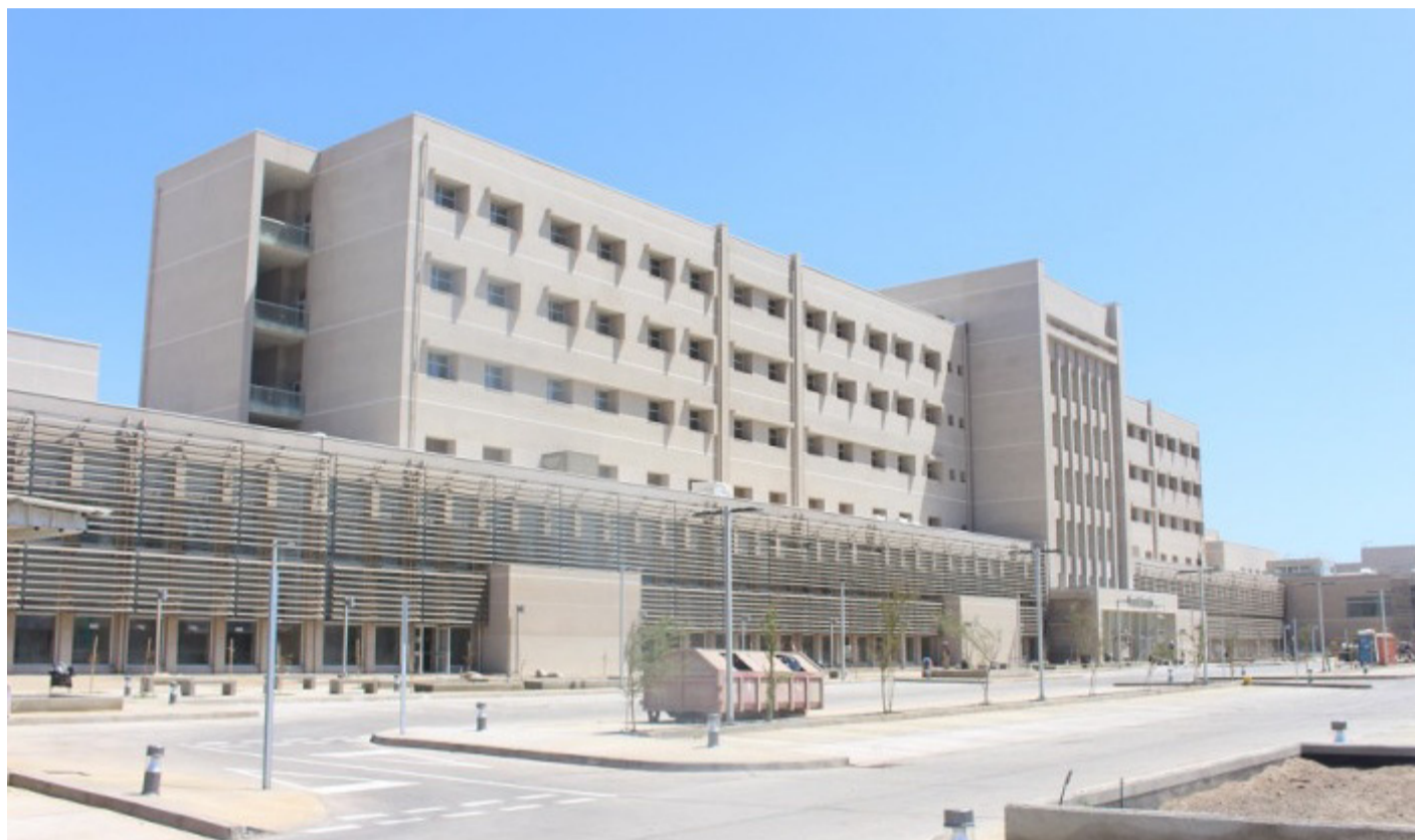
El Hospital Provincial de Ovalle ha presentado un aumento en las consultas respiratorias.

Cabe destacar que los agentes virales pesquisados en las consultas del Hospital de Ovalle en rango etario menores a 1 año, el 54% corresponde a Virus Respiratorio Sincicial (VRS), 16% a Rinovirus y 12% Adenovirus. Respecto a las consultas en el rango etario de 1 a 4 años, el 38% corresponde a VRS, 32% a Rinovirus, 11% Adenovirus y 11% Influenza tipo A.