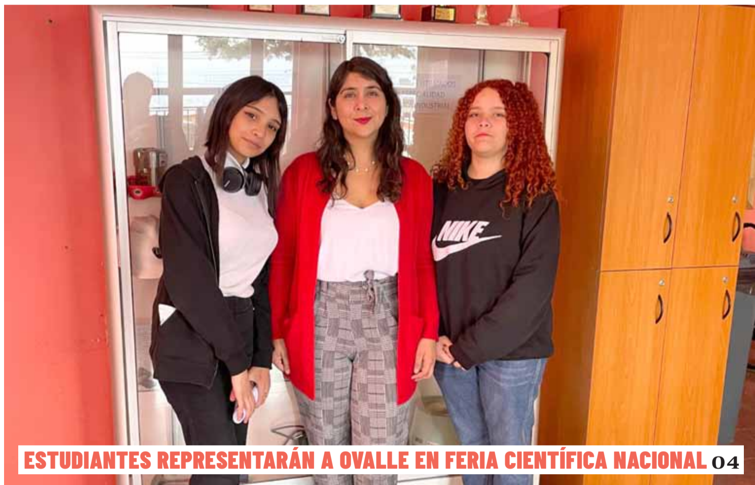
ESTUDIANTES REPRESENTARÁN A OVALLE EN FERIA CIENTÍFICA NACIONAL 04

Un problema latente en la provincia es la presencia de caballos, burros, vacas y cabras que deambulan solos o en grupo a orillas de los caminos, lo que se traduce en un grave riesgo de accidente para los conductores que se topan con ellos. 02