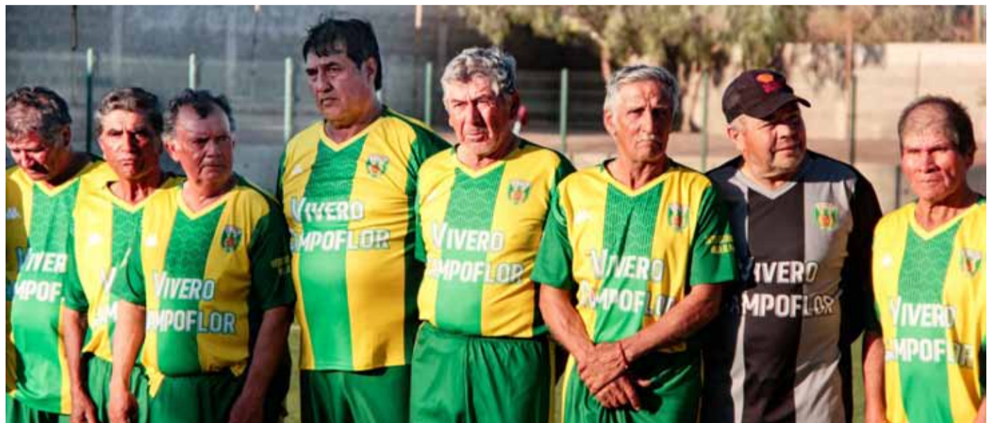
La Liga Limacol para mayores de 60 años congrega a ocho equipos de Monte Patria.

La gira a Argentina en el verano 2023 sin duda marcó precedentes en la comuna, instando a cada vez más adultos de la comuna a sumarse a