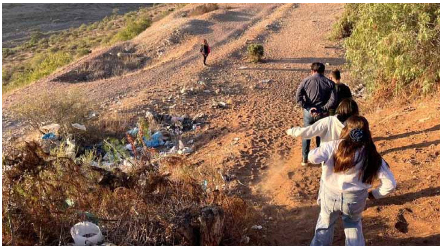
En la quebrada de Cancha Rayada se ha acumulado basura, situación que fue denunciada por la junta de vecinos del sector.

El segundo problema es la presencia de delincuentes, los que muchas veces hayan escondite por las ca-