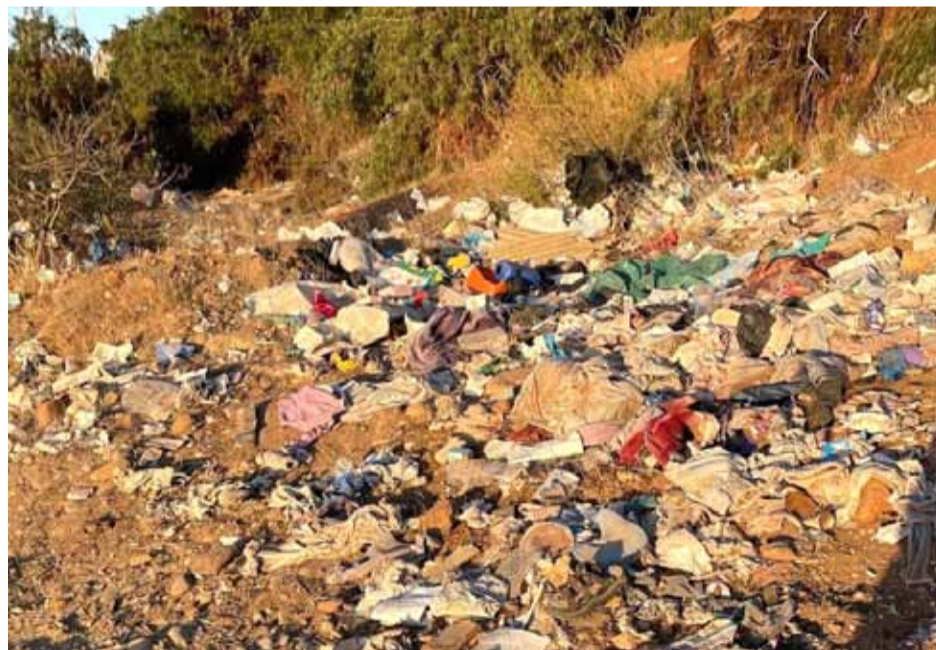
Los microbasurales son una problemática que aqueja a los vecinos de Cancha Rayada.

Por otro lado, el alcalde comenta que también se están tomando medidas para combatir lo microbasurales,