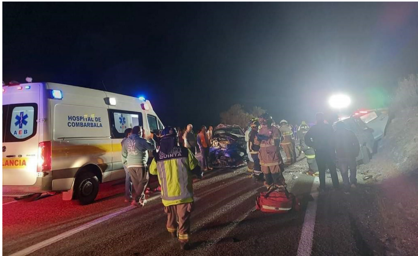
Accidente de tránsito en San Marcos de Combarbalá dejó a dos hombres gravemente heridos y a dos mujeres fallecidas, una de ellas estaba en avanzado estado de embarazo.

Castillo también explicó que “los conductores de ambos vehículos resultaron heridos y tengo entendido que ambos están en el Hospital de Ovalle,