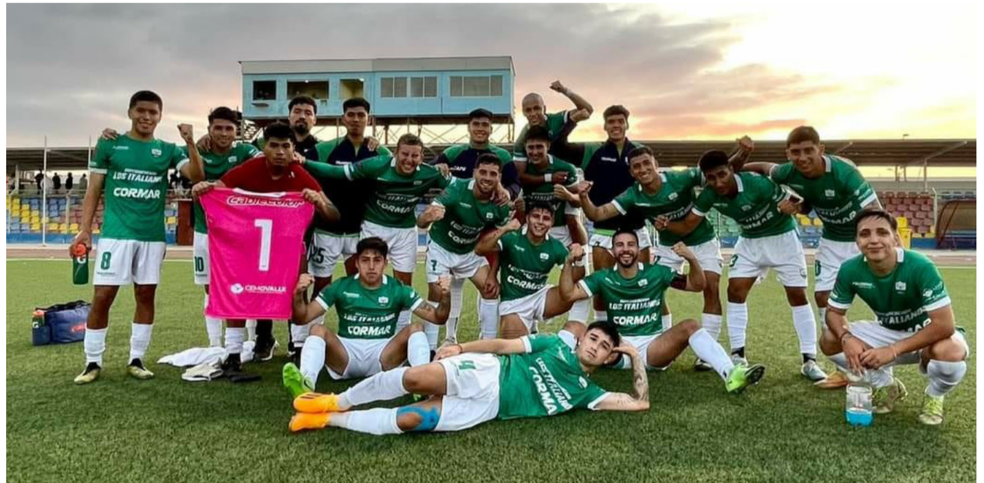
Provincial Ovalle mostró superioridad frente al equipo mejillonino.

El inicio del encuentro se vio un tanto apretado, con ambos equipos buscando la apertura del marcador, sin embargo, pese a los esfuerzos de ambas escuadras, las defensas actuaban férreamente, no dejando ninguna chance de gol al oponente.