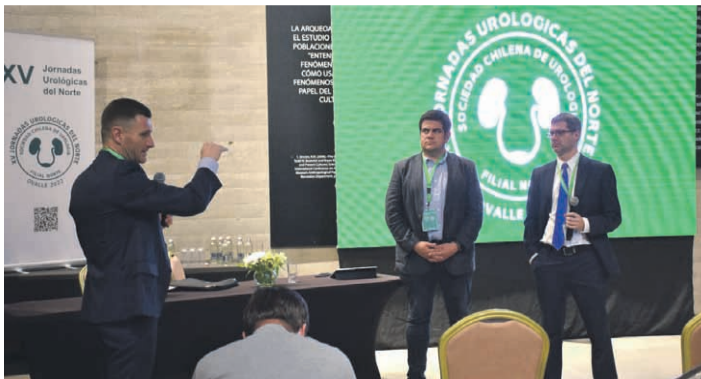
Más de 30 especialistas participan en Ovalle en la decimoquintas Jornadas Urológicas del Norte.