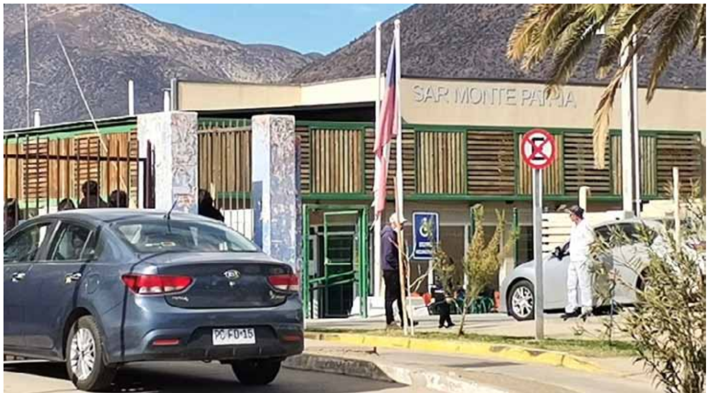
El Servicio de Salud ha buscado alternativas para acercar las atenciones a las comunas y localidades rurales.

“En tema de infraestructura estamos avanzando, y ya está casi en un 95% lo que es nuestro nuevo CESFAM de Carén, que estaba funcionando en pésimas condiciones cuando llegamos, sin resolución sanitaria y con box que estaban funcionando en baños adaptados, ahora estamos viendo cómo