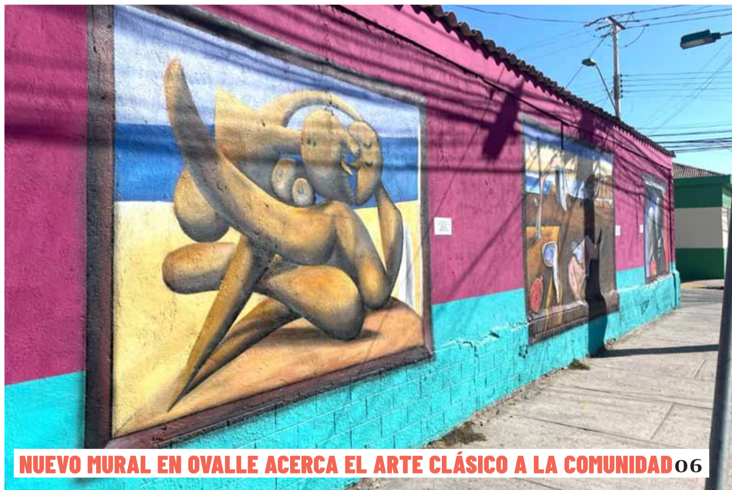
NUEVO MURAL EN OVALLE ACERCA EL ARTE CLÁSICO A LA COMUNIDAD 06