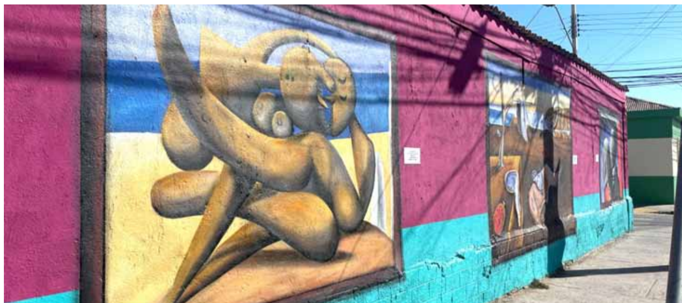
En la intersección de Vicuña Mackenna con Tamaya, se puede observar este precioso mural creado por el artista ovalino, Karpin (foto de abajo, izquierda). EL OVALINO

El trabajo, ubicado en la intersección de Vicuña Mackenna con calle Tamaya, a sólo tres cuadras de la Plaza de Armas, lleva al muro tres obras icónicas de grandes nombres