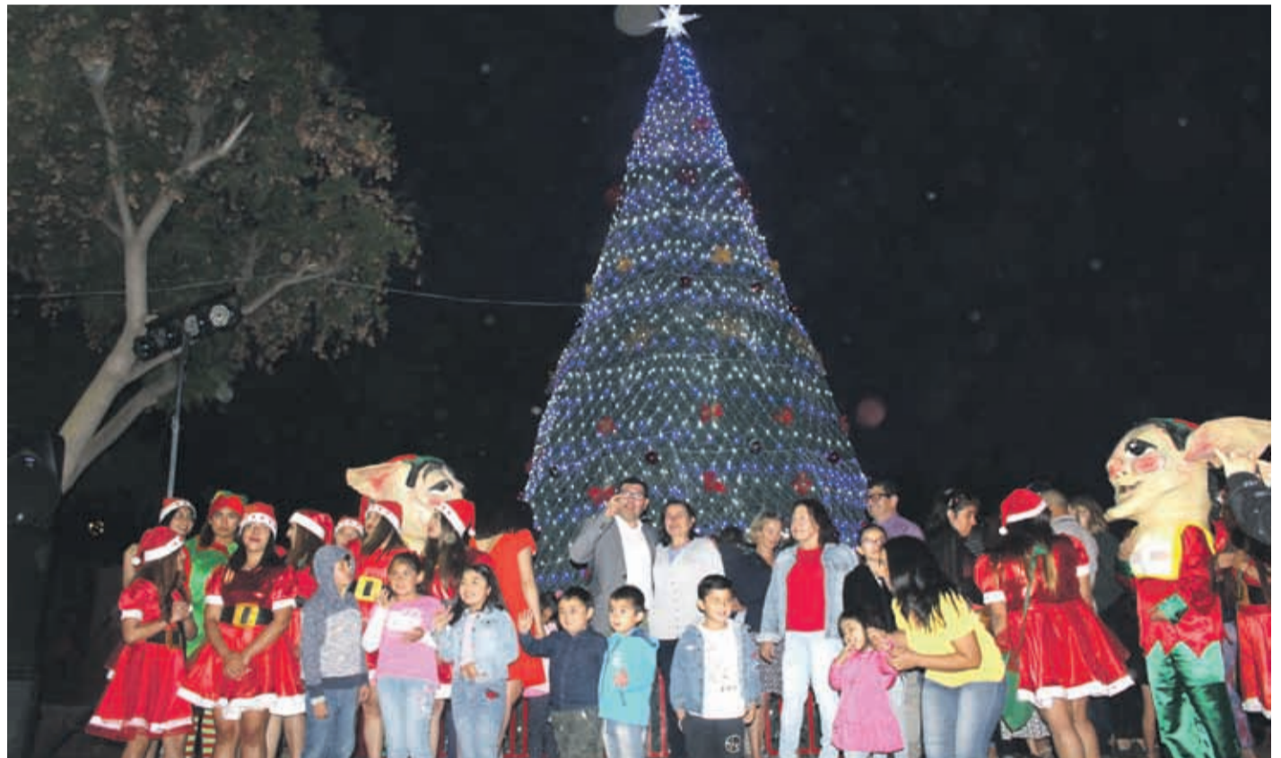
En total son 14 los árboles de navidad repartidos entre las distintas localidades de Monte Patria.

Pero no es nuevo. Desde 2017 se están llevando acciones “para promover un sano ambiente” en navidad, que sobrepase a los días 24 y 25 del mes de diciembre. Queremos que sea durante todo el mes y que eso dure hasta el mes de marzo”, dijo el alcalde, objetivo que se acerca este año con la incorporación de nuevos elementos navideños.