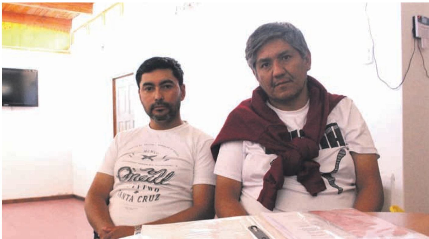
Dos de los cinco trabajadores que no han recibido su sueldo del mes de noviembre y su finiquito.

Irregularidades en las condiciones laborales, no pago de sueldos e incumplimiento de contrato, son algunas de las denuncias que realizan cinco ex trabajadores de la empresa Sicall S.A. La inmobiliaria actualmente se encuentra a cargo de una obra de construcción