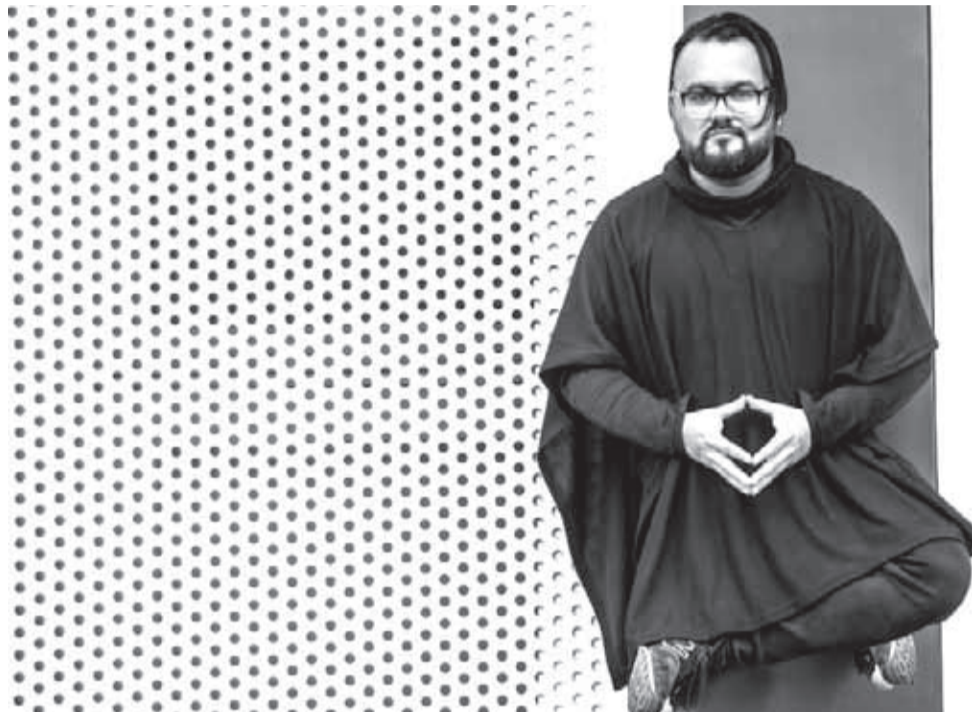
En "No Necesito Mas" Hauyon explora nuevos sonidos e influencias a dos décadas de sus inicios en la escena indie regional.

El sucesor del álbum "La Trampa de la Evolución", fue lanzado en el mes de agosto y se encuentra actualmente en plataformas de streaming. Este sábado 14 de diciembre podrá ser escuchado en vivo en el Bar de Lucila (Nuevo Peregrino), ubicado en Cordovez 765 en la capital regional, a las 22:30 horas.