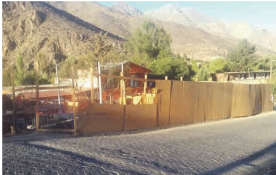
El plazo de término de la obra estaba previsto para el mes de septiembre.