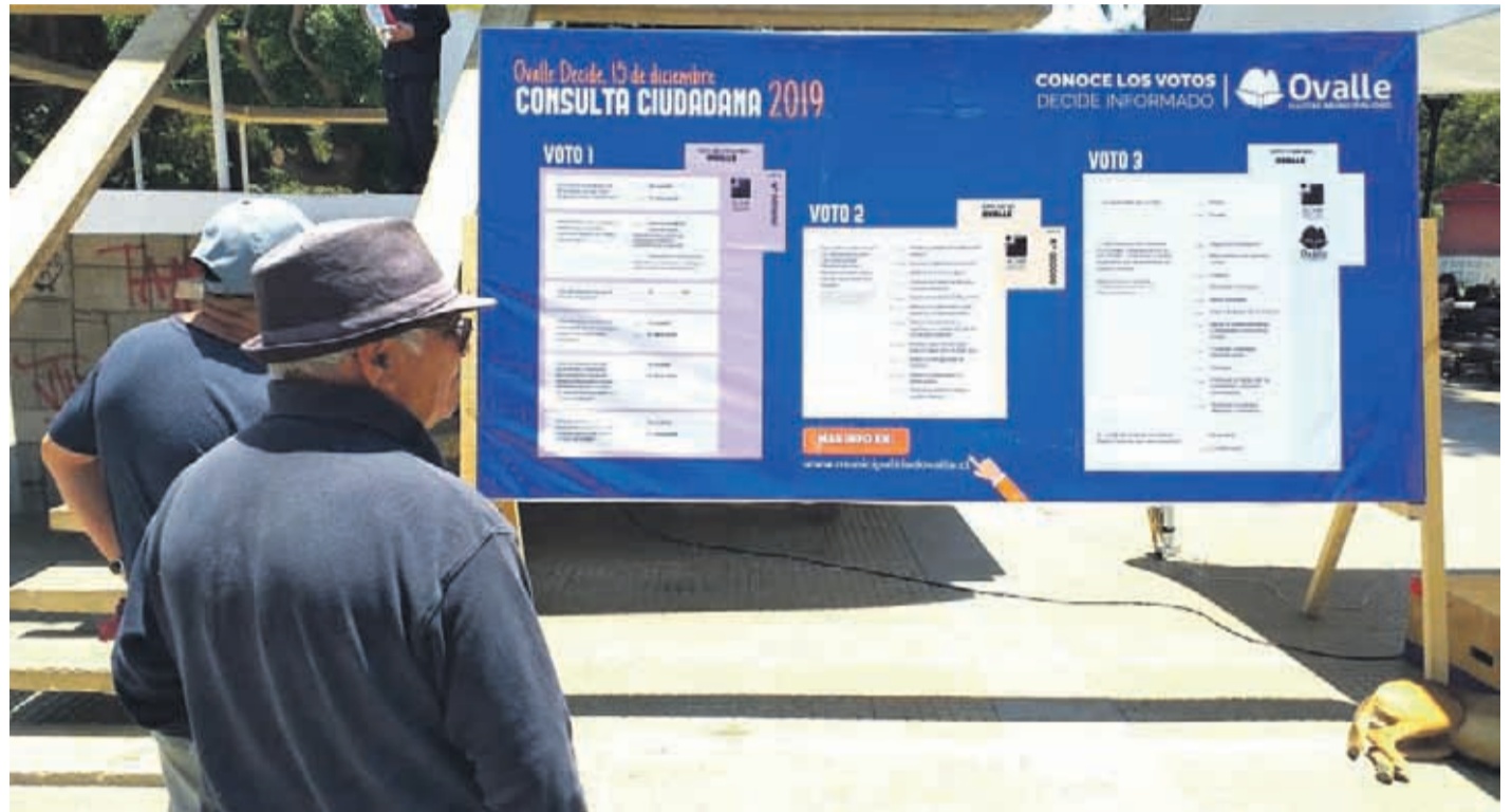
Las personas ya conocen las tres papeletas para este domingo.

Solo resta un día para la consulta ciudadana que impulsa la Asociación Chilena de Municipalidades, a través de más de 200 municipio en el país. La región no quedará exenta de este proceso que para los alcaldes es considerado