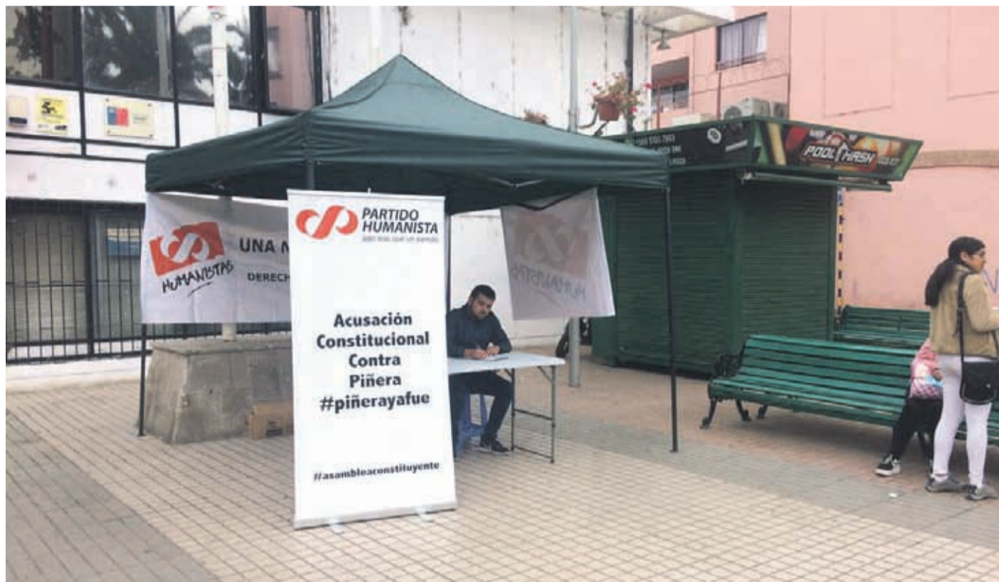
El PH en Ovalle sería la una agrupación política que integraba el Frente Amplio.

Refirió que algunos partidos del Frente Amplio, hicieron alguna jugada personal