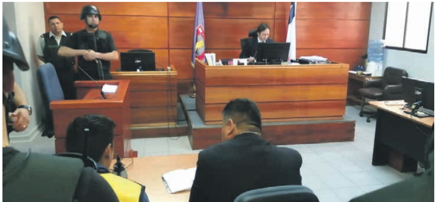
El control de detención se realizó la mañana de este viernes en el Juzgado de Garantía de La Serena.

El persecutor agregó que “además en un momento la habría tomado