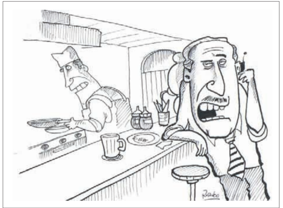
Hablando de política me estoy comiendo un aliado.