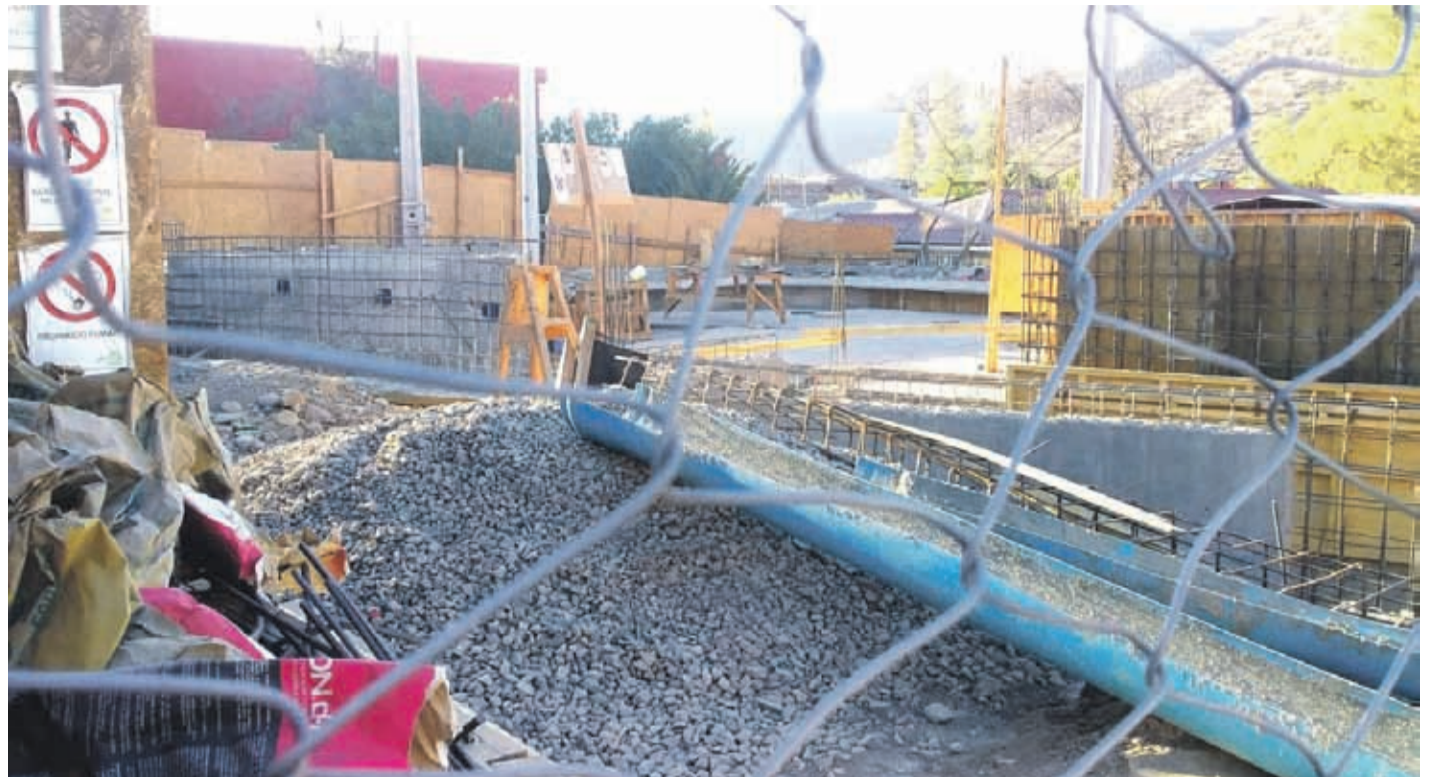
La obra aún se desarrolla en la plaza de la localidad de Pichasca.