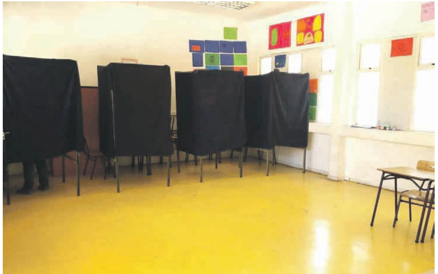
La comuna de Monte Patria ya instala los cámaras y urnas para la consulta ciudadana.

De los 216 municipios que se incorporarán a la consulta ciudadana, 113 confirmaron que utilizarán el voto