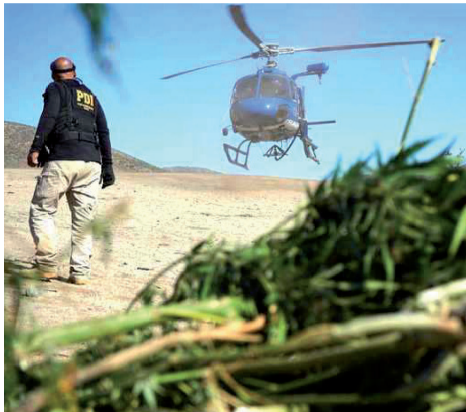
Los narcocultivos representan una amenaza creciente en la provincia.

"En estas provincias están emergiendo no uno, sino varios grupos criminales atendiendo este 'giro comercial' y están no sólo lidiando con terrenos