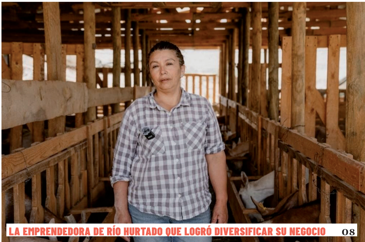
LA EMPRENDEDORA DE RÍO HURTADO QUE LOGRÓ DIVERSIFICAR SU NEGOCIO 08