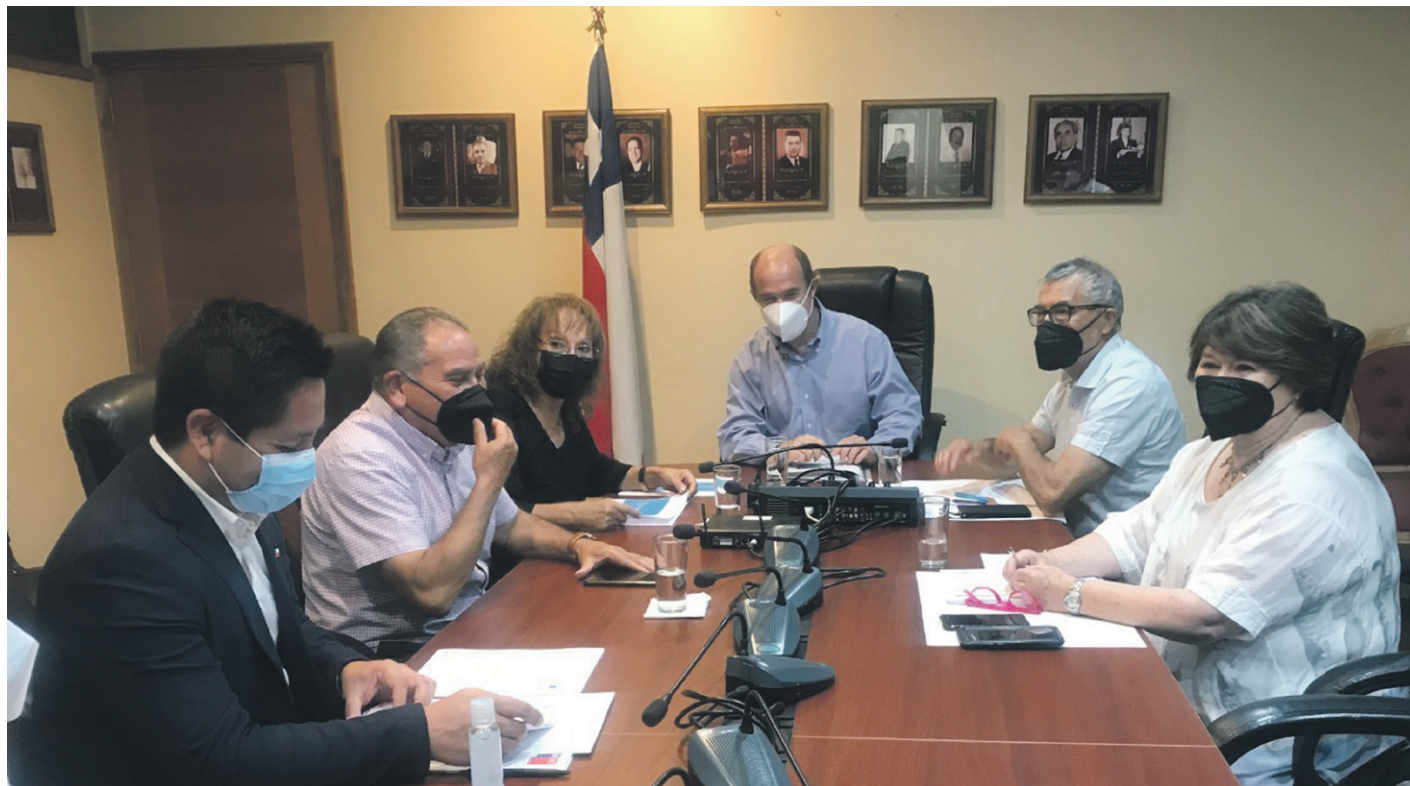
La región tiene 757.586 habitantes, de los cuales 18,8% forman parte de la ruralidad.

Entre las principales problemáticas asociadas al acceso a la vivienda y los subsidios en estas zonas apartadas está la irregularidad en la tenencia de los terrenos, cuyo origen está en procesos de