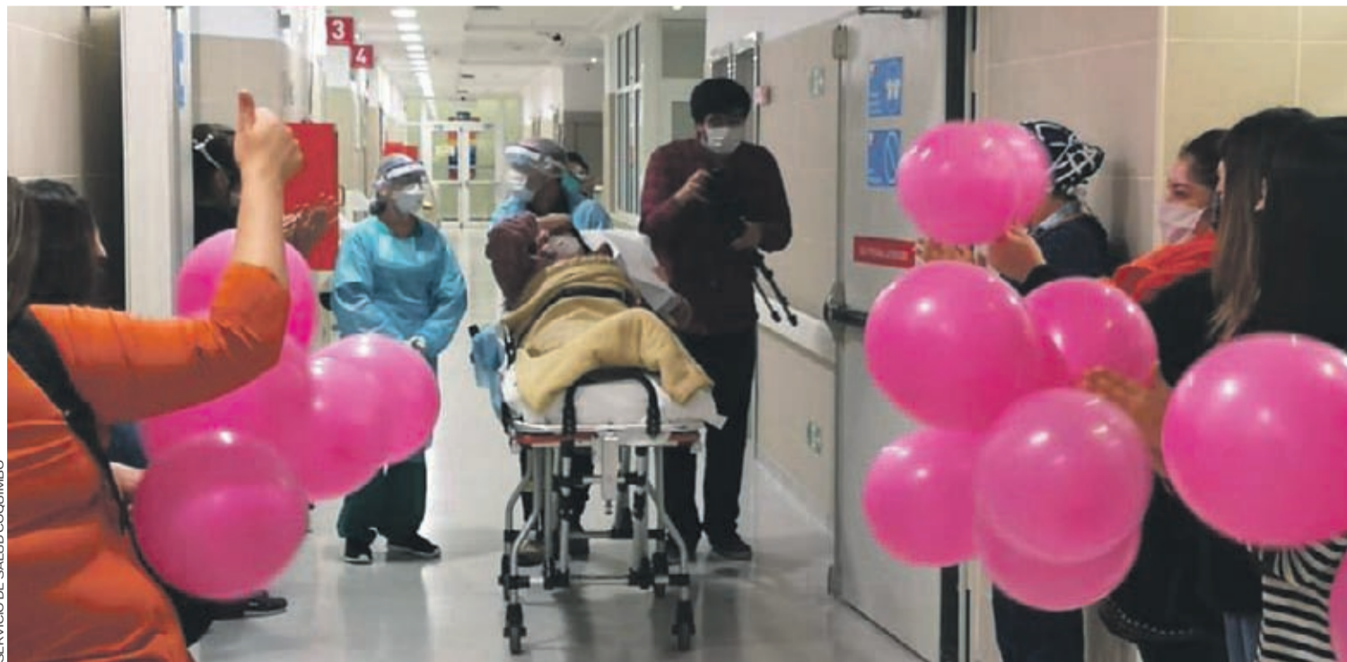
SERVICIO DE SALUD COQUIMBO

Su lucha no fue fácil. Fue la primera en la ciudad y es la que ha tenido que requerir de mayores cuidados médicos. Pero la tarde de este martes la noticia confirmó lo que sus fuerzas le decían: había superado al coronavirus. 05