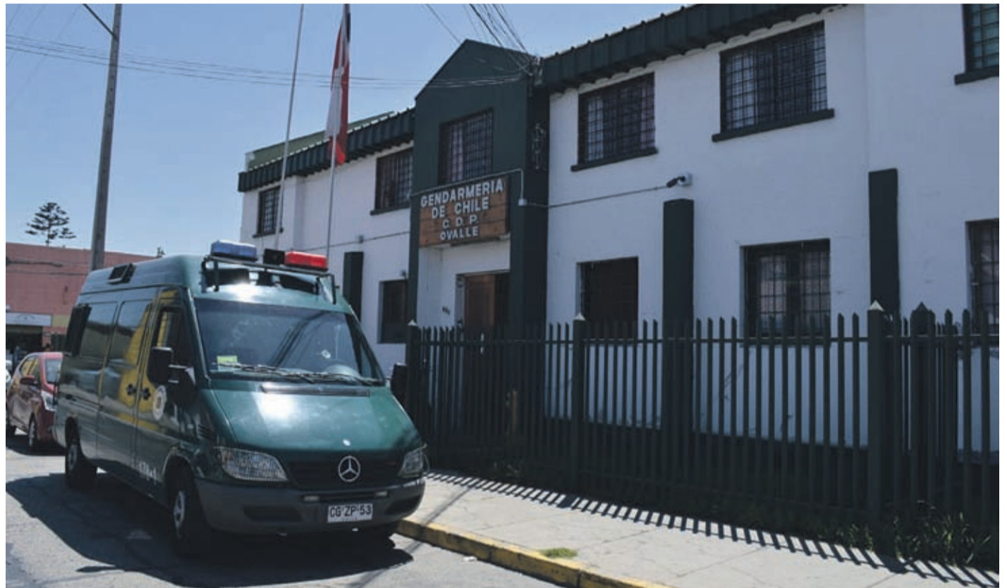
Las solicitudes de libertad condicional son un proceso normal y no tienen relación con la pandemia de Coronavirus.

El presidente de la Corte de Apelaciones, ministro Fernando Ramírez -quien encabeza la comisión- informó que no hubo variaciones en el resultado a raíz de la alerta sanitaria decretada en el país por coronavirus, ya que los requisitos para obtener el beneficio están regulados por ley, debiendo los internos contar con un informe favorable del Consejo Técnico del establecimiento penitenciario al momento de postular.