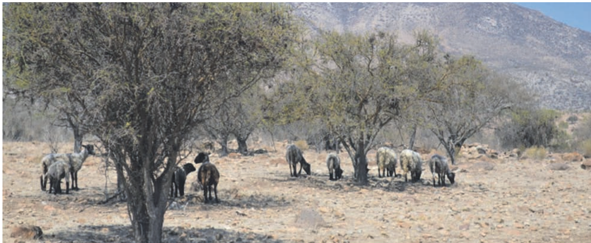
El sector seco de la región seguiría crítico en cuanto disponibilidad de agua para este año.