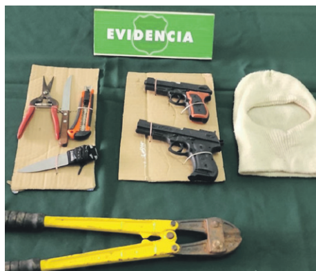
Con elementos para cometer delitos fueron detenidos los tres sujetos que intimidaron y robaron el jueves al trabajador de una bencinera

El tercero de los antisociales, D.E.L.M de 44 años, fue formalizado por portar elementos destinados a cometer