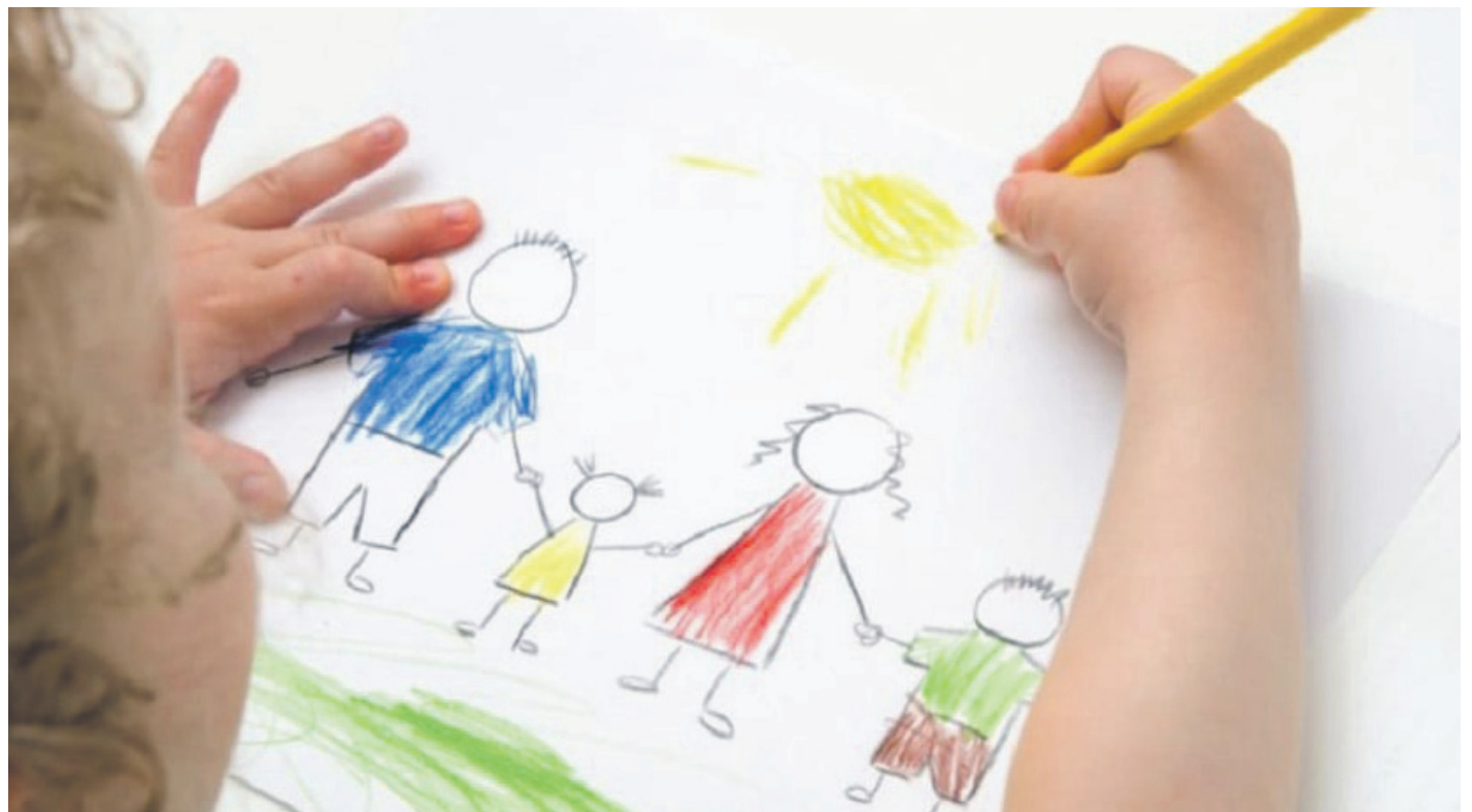
Los programas de Familia de Acogida ofrecen protección y apoyo a pequeños en condición vulnerable