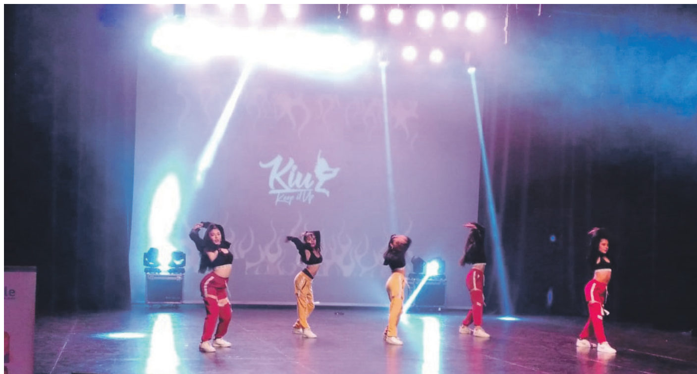
La gala desarrollada la noche de este sábado le dio protagonismo a los jóvenes como agentes esenciales en el cambio social

Ahondando en esto, Henríquez explicó cuáles fueron los inicios de su agrupación y detalló que "nosotros no tenemos jerarquías, esto surgió como un grupo de 7 amigos de entre 14 y 15 años, que comenzaron a bailar en un taller del Liceo Politécnico de Ovalle,