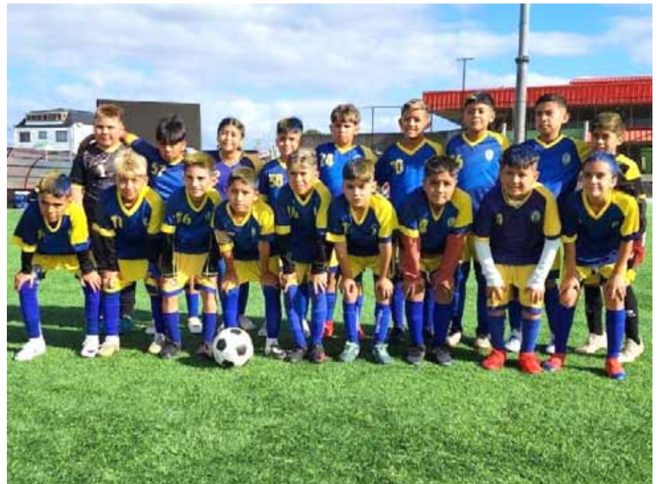
Academia de Fútbol Municipal Ovalle, categoría 2012 B, tercer lugar en "Copa Oro".