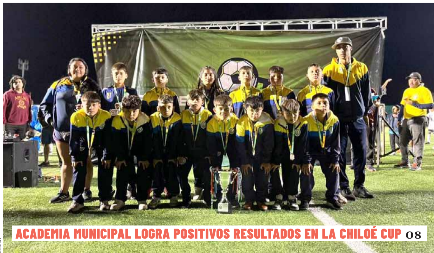
ACADEMIA MUNICIPAL LOGRA POSITIVOS RESULTADOS EN LA CHILOÉ CUP 08

UN DETENIDO POR ROBO CON VIOLENCIA EN PUNITAQUI 07