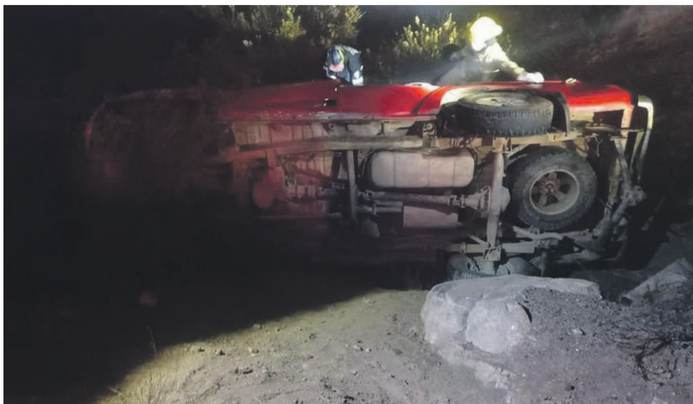
Una camioneta volcó en la cuesta El Hinojo en la madrugada de este domingo.