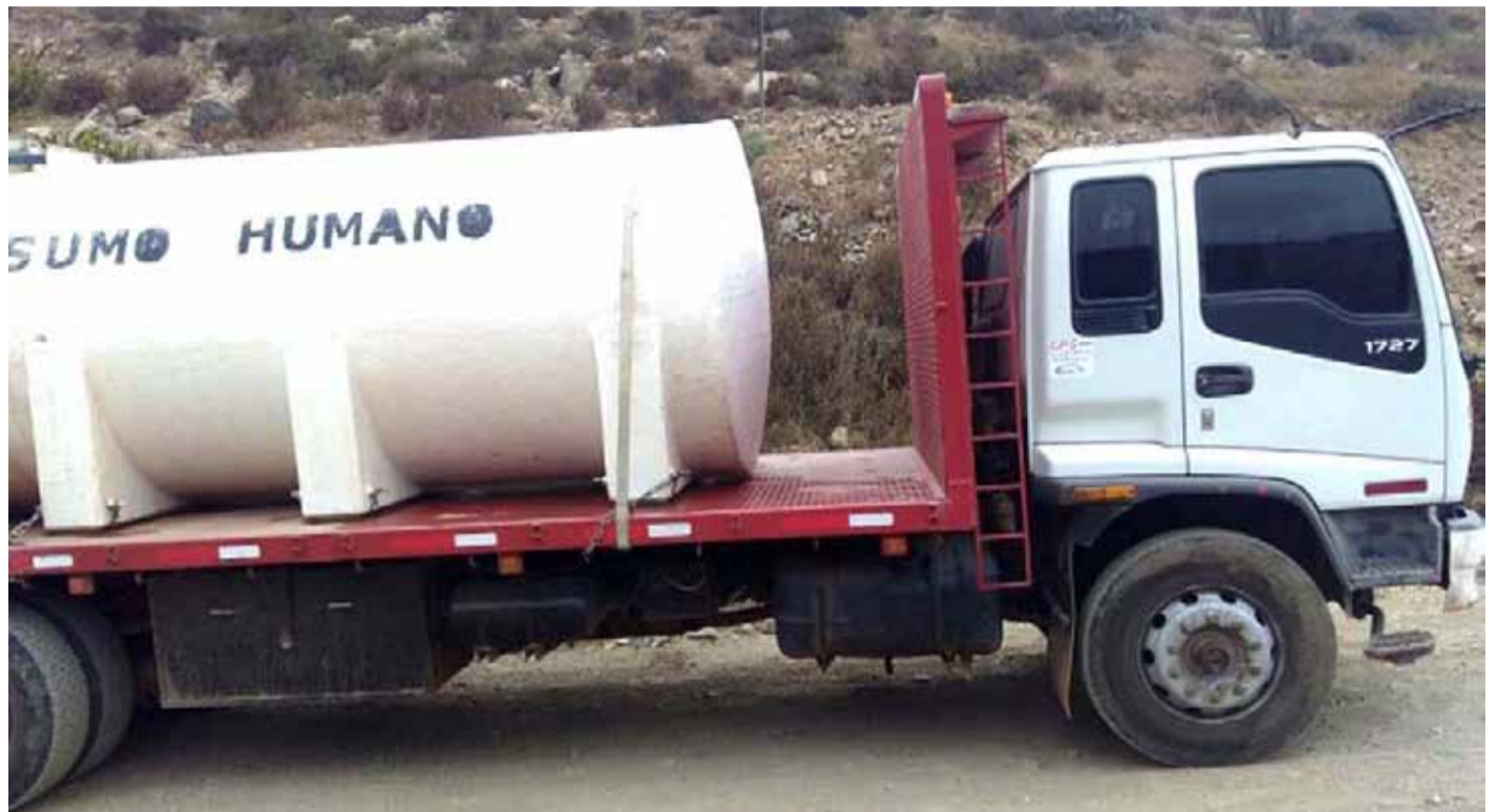
Camiones aljibes recorren diversos puntos de la provincia para abastecer de agua a familias afectadas por la sequía.

Un total de once sistemas de agua potable rural necesitan ser abastecidos por las municipalidades y el Estado, esto, según los datos entregados por la Asociación Gremial de APR de la Provincia del Limarí. No obstante, la cifra sería mayor en consideración de que hay localidades que no cuentan con estos comités. En ese sentido, renacen demandas como nuevos embalses y desaladoras para enfrentar la crisis hídrica.